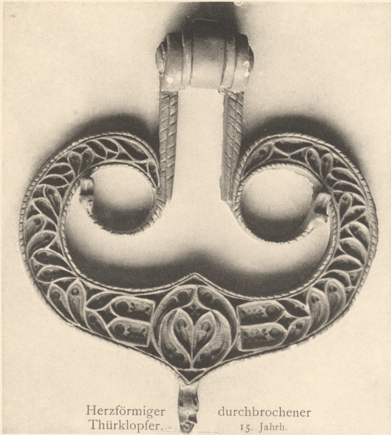
Herzförmiger durchbrochener Thürklopper. 15. Jahrh.