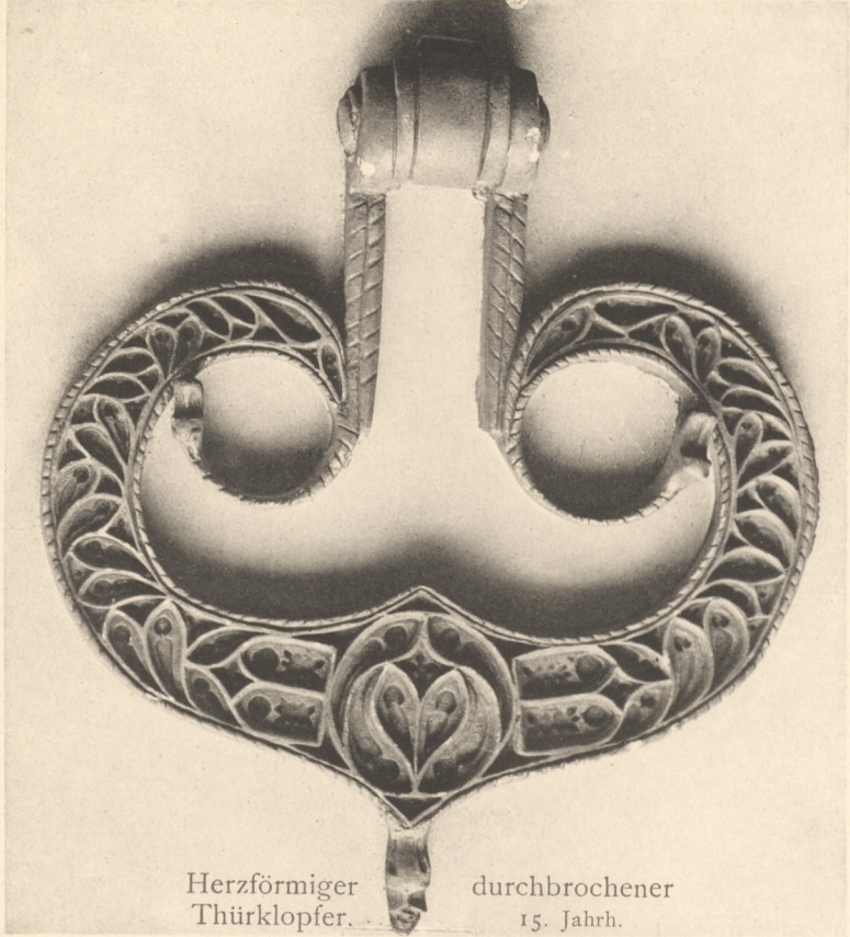
Herzförmiger durchbrochener Thürklopper. 15. Jahrh.