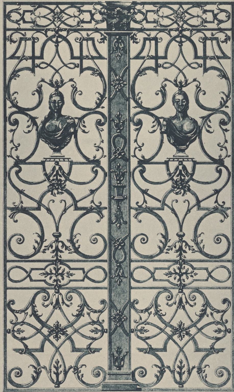
Aus dem Kunstgewerbemuseum in Dresden.