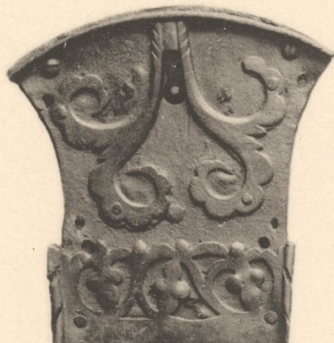
Gothisches Truhenschloss, 15.—16. Jahrhundert. Germanisches Museum in Nürnberg.