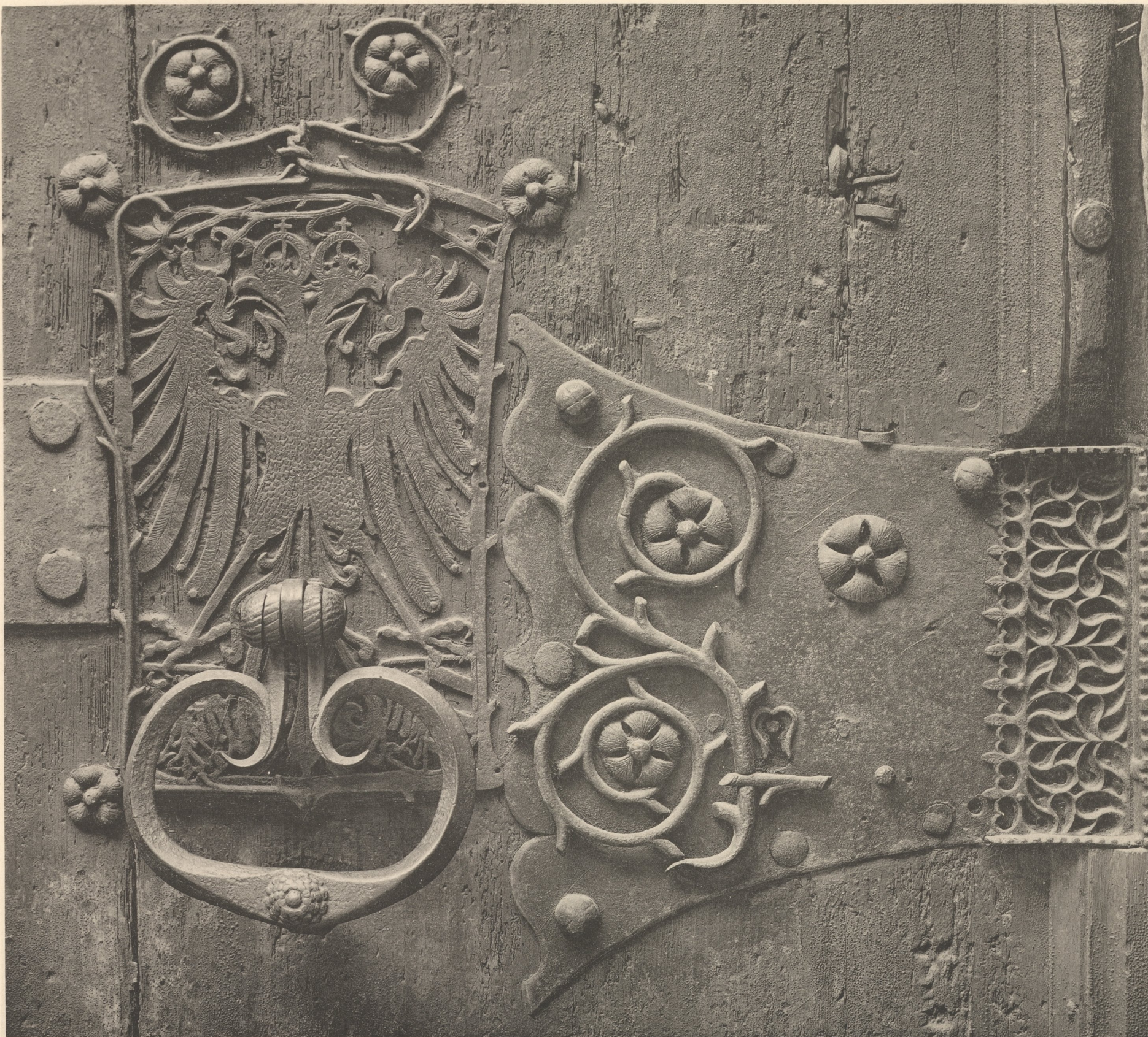
Lichtdruck von Jos. Albert. München.