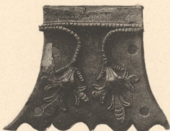
Gothisches Schlossblech. 15. Jahrhundert. Riedinger-Sammlung in Augsburg.