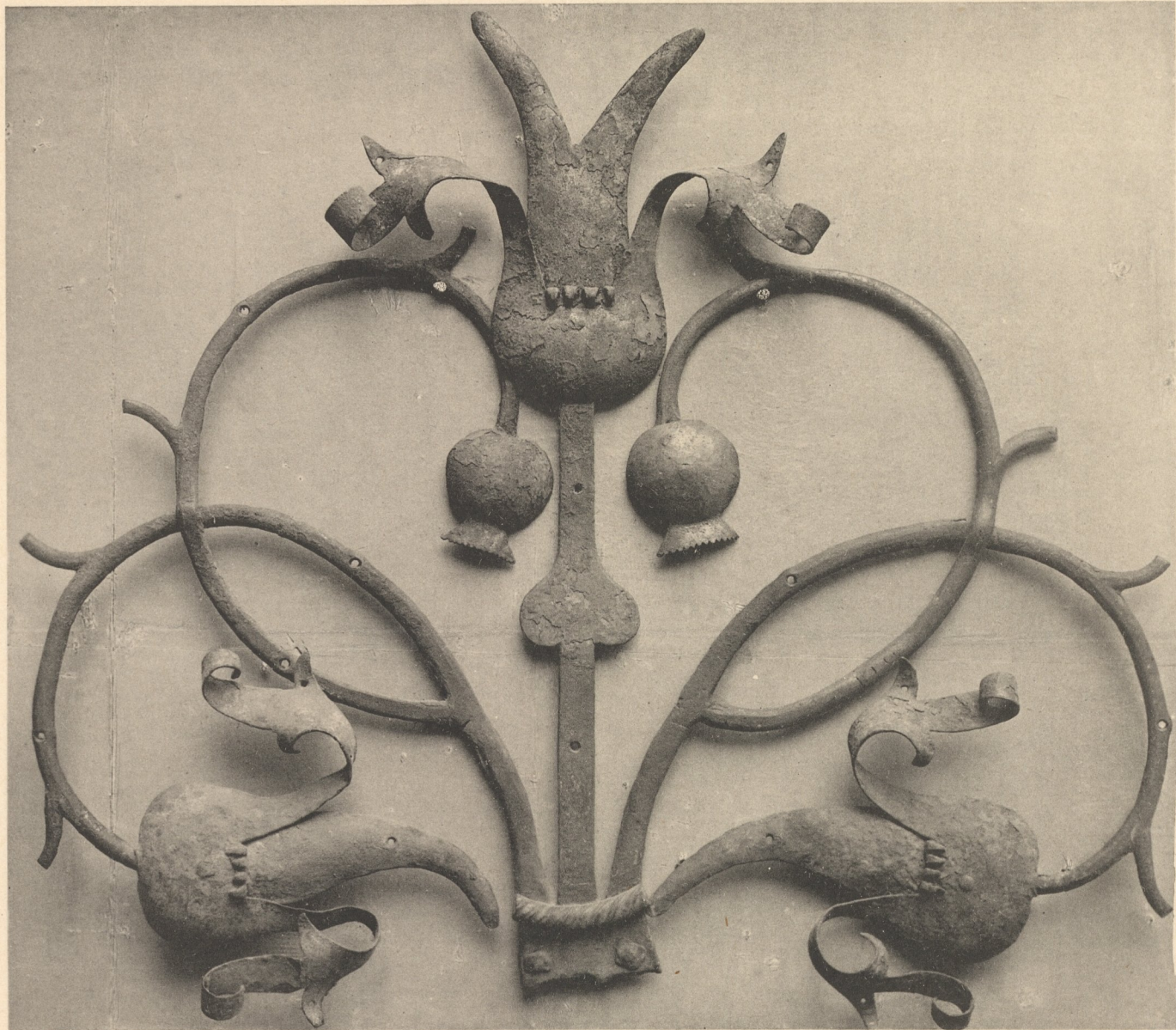
Gothisches Thürband mit Blumen und Mohnköpfen, mit Resten von Bemalung und Vergoldung. Süddeutschland. — 15. Jahrhundert. — Germanisches Museum in Nürnberg.