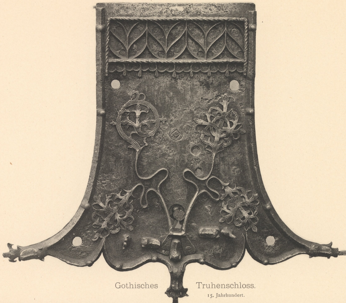
Gothisches Truhenschloss. 15. Jahrhundert. Riedinger-Sammlung in Augsburg.