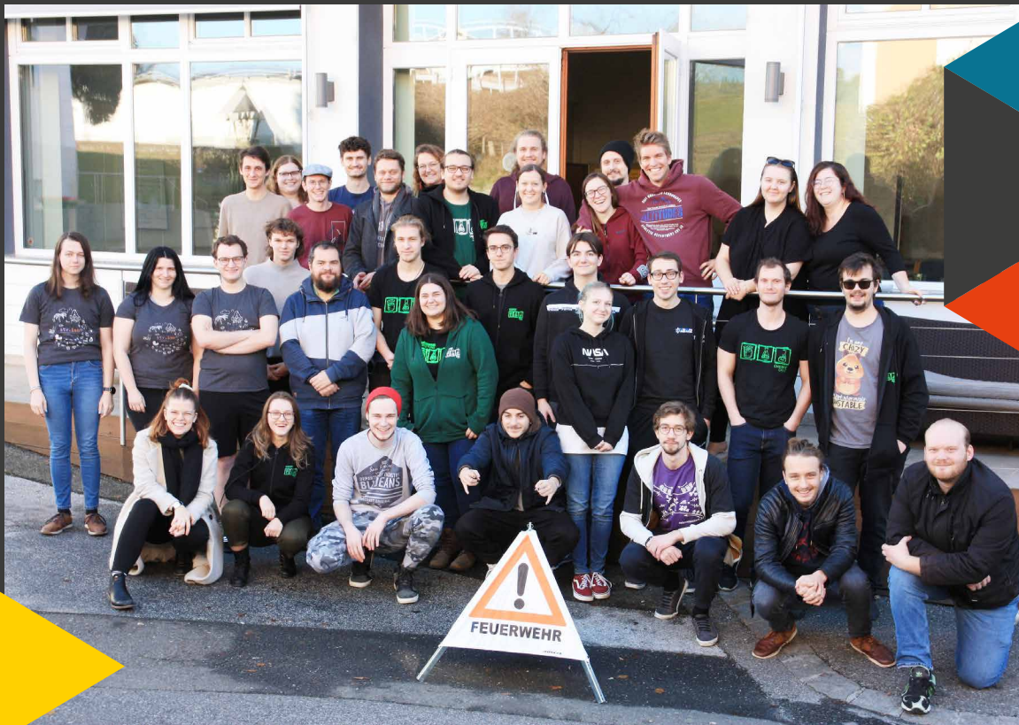
Studienvertreter_innen der HTU Graz am HTU-Seminar 2023