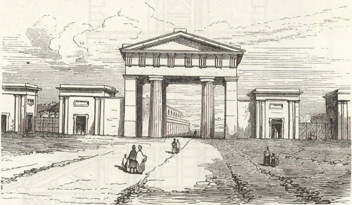
Fig. 547. — Gare du chemin de Londres à Birmingham.