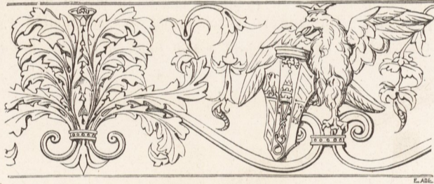
Nr. 103. Detail von dem Frieze eines Kamins im Obergeschofs des Palazzo Ducale.

sem Kamin erschien mir einer besonderen Abbildung im Holzschnitt Nr. 103 werth.