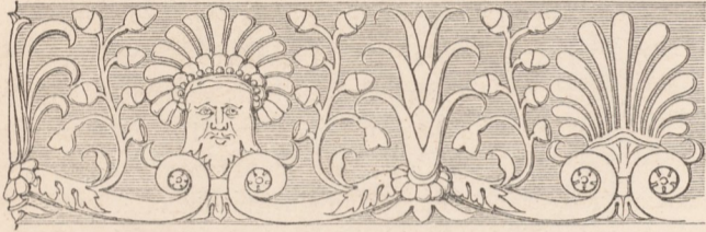
Nr. 69. Friesornament am Tabernakel in S. Lorenzo zu Spello.

verblichen, aber noch allerwärts deutlich erkennbar; sie bedeckte: a) am Gebälk: die Sima, die Eier und Lanzettblätter des oberen Kymations, die Vorderfläche der Zahn-