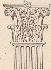
Nr. 54. Capitell am Portal von S. Niccolò zu Foligno.

S. Niccolò (Nr. 49. 14) schmückt als Haupteingang zur Kirche ein gefälliges Renaissance-Portal aus bester Zeit. Dasselbe ist jedoch weit schlichter als das von S. Agostino, und besonders wegen der Pilastercapitelle von anmüthiger zierlicher Composition erwähnenswerth (siehe nachstehenden Holzschnitt Nr. 54).