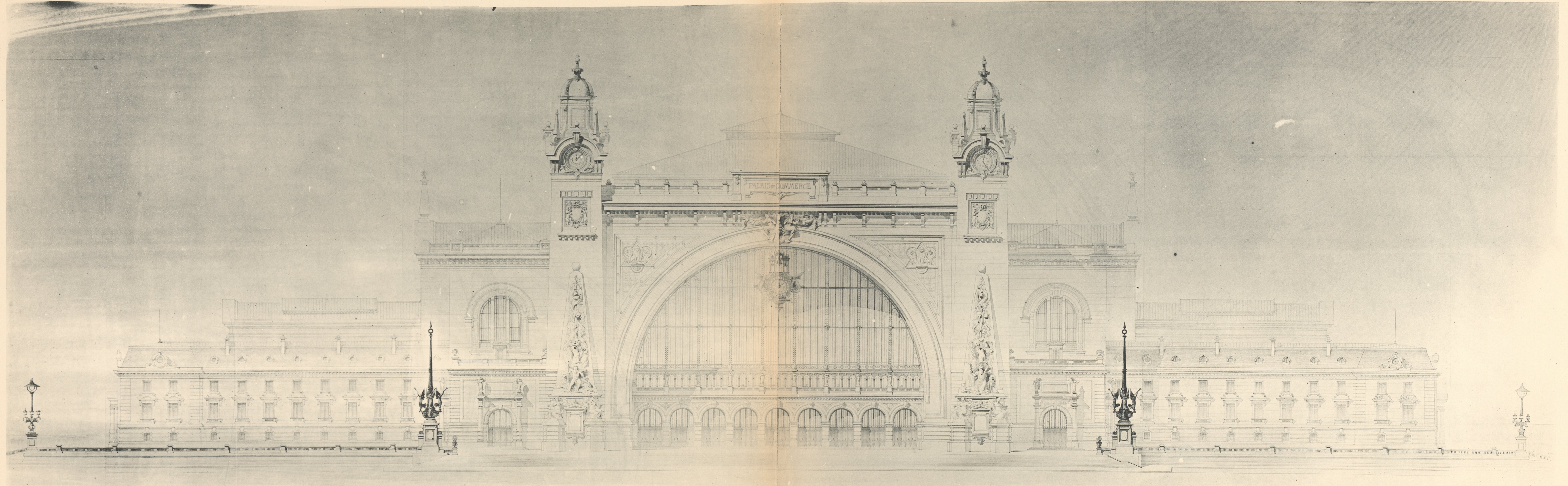
FAÇADE PRINCIPALE PAUL LE CARDONNEL. - Palais du Commerce.

AR. GUERINET, Editeur, Faubourg Saint-Martin, 140, Paris.