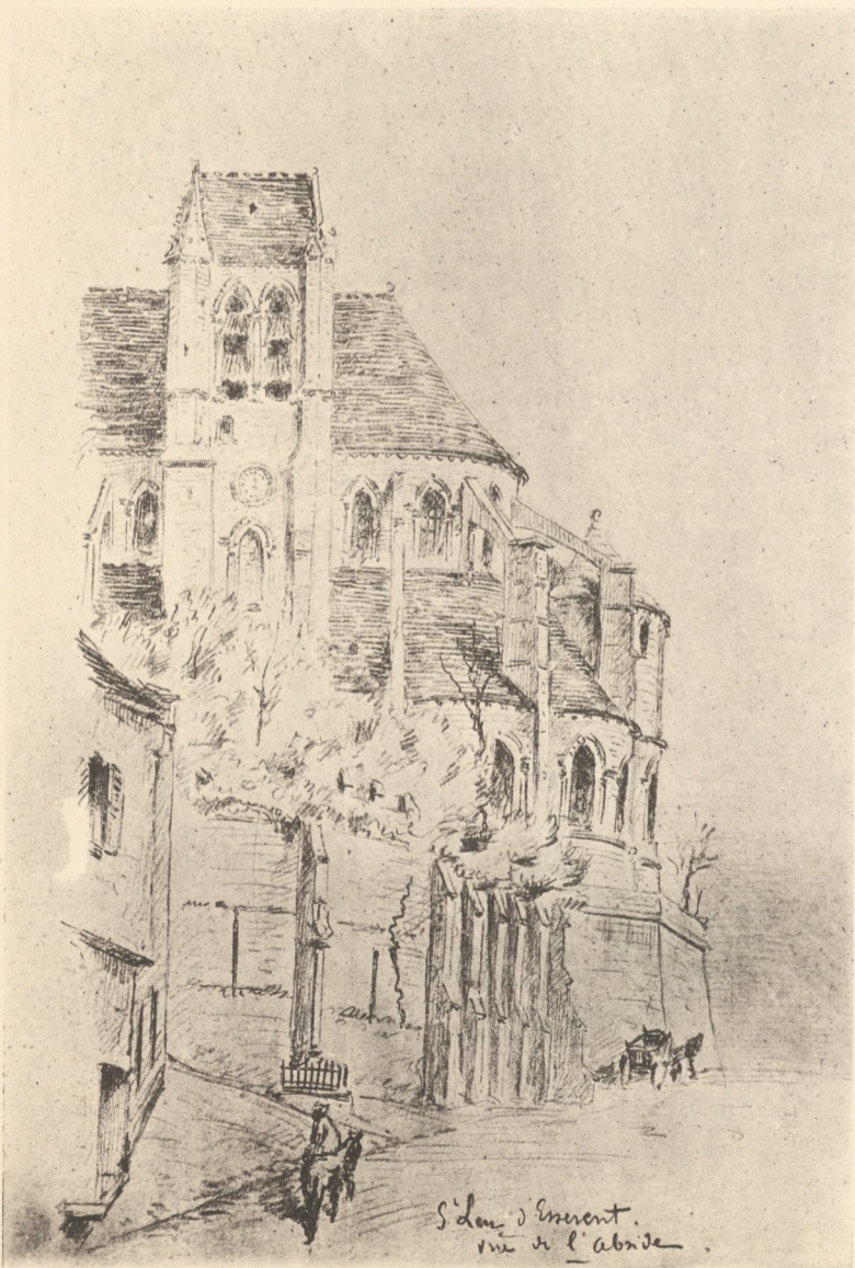
VUE DE L'ABSIDE.