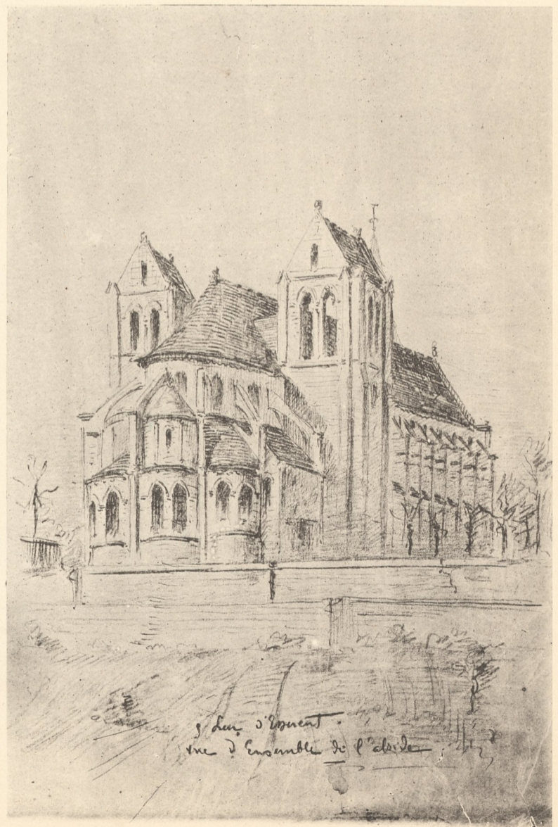
AR. GUÉRINET. Éditeur, Faubourg Saint-Martin, 140. Paris. VUE GÉNÉRALE DE L'ÉGLISE.