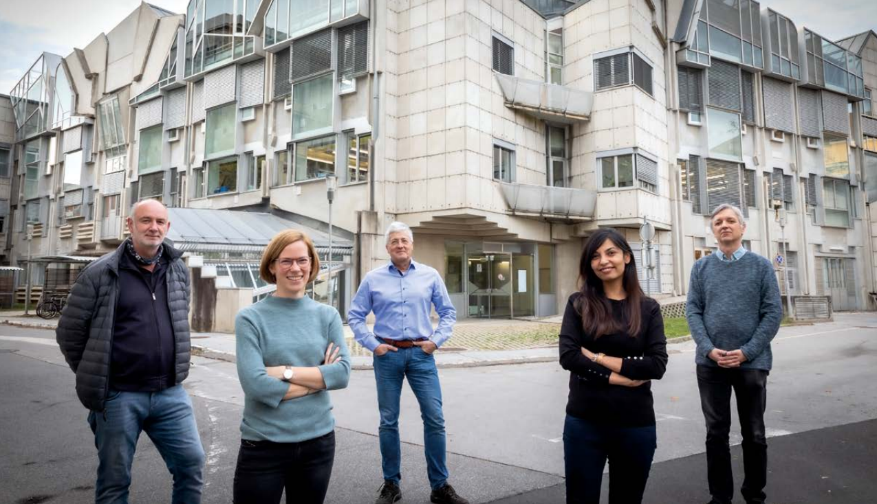
Grazer Forschende identifizieren Biomarker für Herz-Kreislauf-Erkrankungen