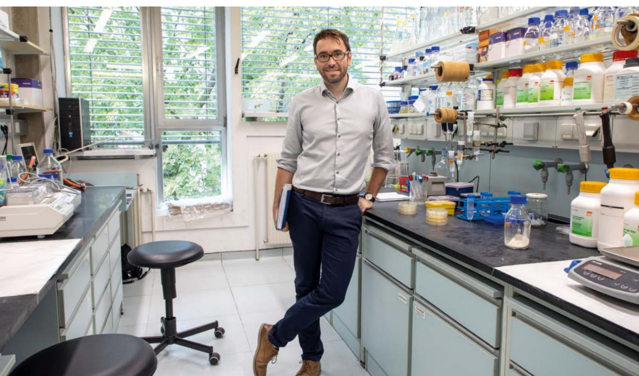
Nachhaltige Leuchtmittel: LEDs aus bakterieller Produktion