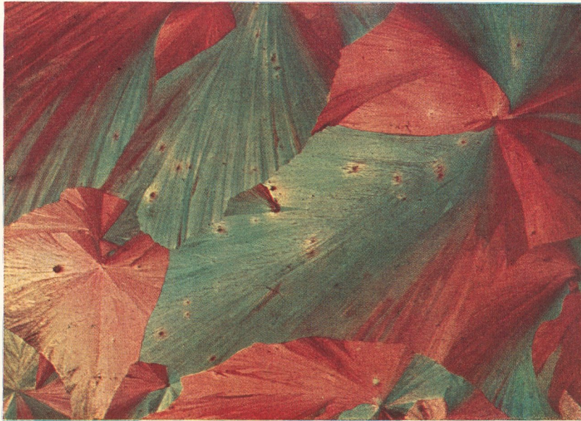
Fig. 3. Kristallbild von Kalium tartaricum

Zu dem Artikel: R. Schmeplik, Aus der Werkstatt der Natur (Photographische Rundschau und Mitteilungen)