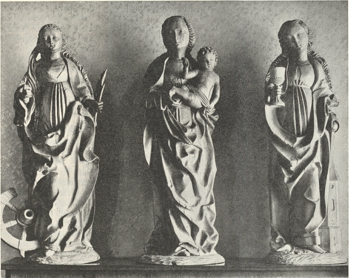
Abb. 380. Madonna mit Tabernakeljungfrauen aus St. Anna ob Passail. Um 1520

Werke unbekannter Meister? Ihrer wäre eine Legion. Nicht bloß in der Ära der Romanik, sondern auch der Gotik, ja auch des Barocks. Aussichtslos, ihr Inkognito lüften zu wollen, auch wenn man noch 500 Druckseiten zur Verfügung hätte. Zur stilistischen Einordnung würde die Formanalyse genügen, zur Eruierung ihrer Meister bedürfte es aufhellender Archivalien. Hier also nur noch etliche klärende Hinweise zu einigen bemerkenswerten Skulpturen.