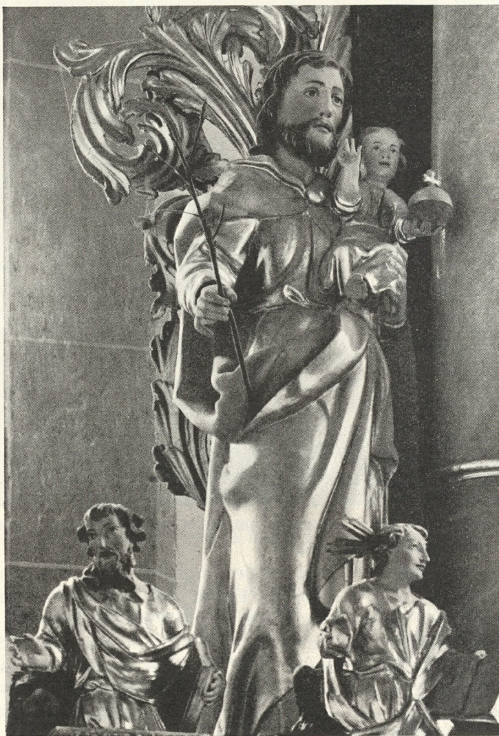
Abb. 369. Franz Camerlander: Joseph vom Hochaltar in Ranten. 1697

Im Abschnitt St. Lambrecht war schon von dem streitbaren Weißenkirchener Bildhauer Franz Camerlander die Rede. Ihm wies ich im Stiftebuch sein erstes beglaubigtes Werk nach: 1670 ward unter Baumeister