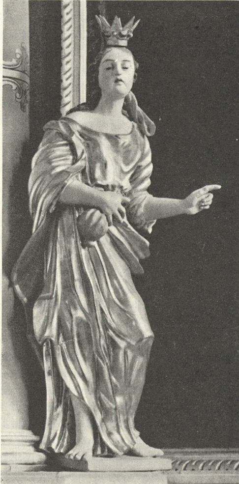
Abb. 363. Katharina in Hirscheegg. Von Veit Harer? 1643

Am 8. Juli 1643 bewarb sich hier um das Bürgerrecht Veith Harer „Pilthauer“, am 5. August ward es ihm verliehen. Kaum ein Jahr später ist auch schon ein Werk bezeugt: