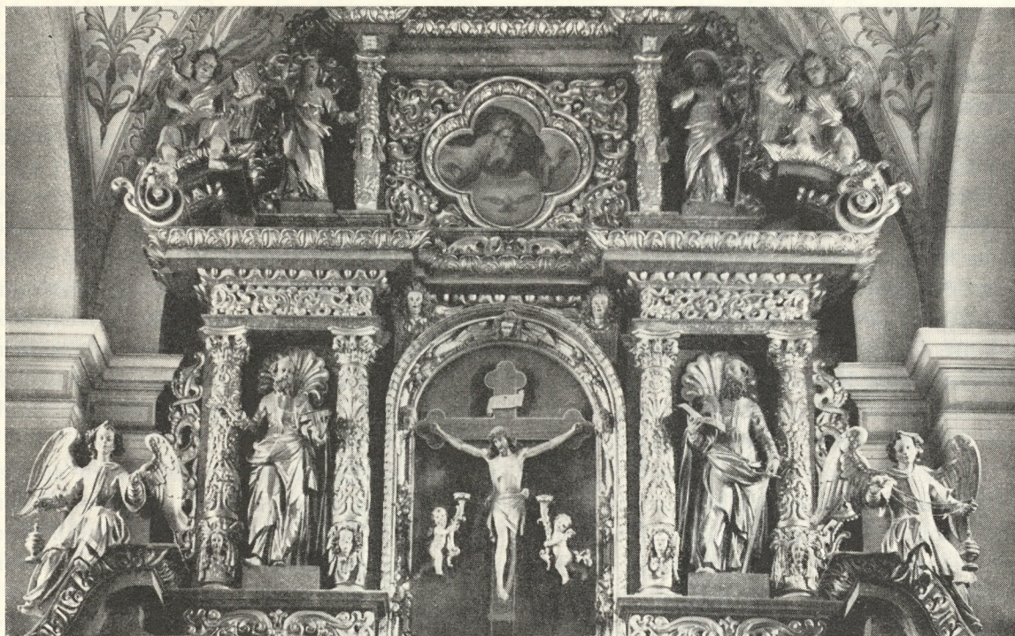
Abb. 361. Vom Hochaltar des Marburger Domes, jetzt in Hl. Kreuz am Waasen