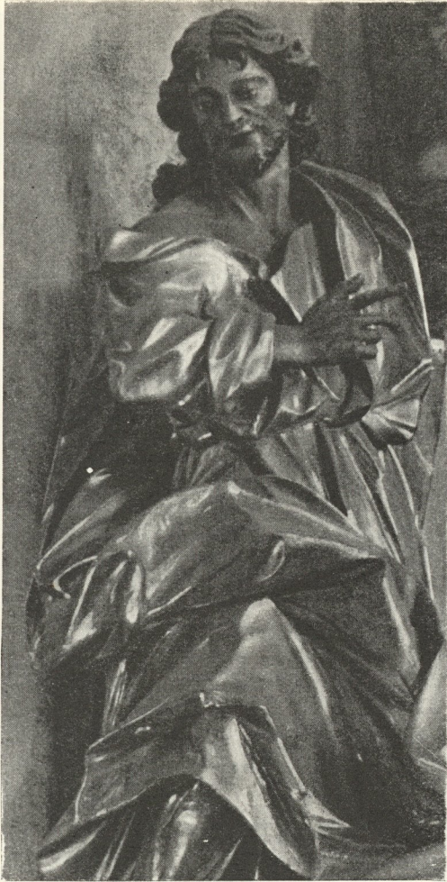
Abb. 357. Judas Thaddäus: Im Dom 1738