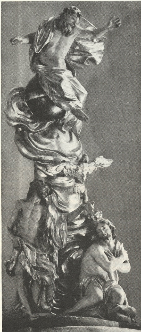
Abb. 356. Taufstein-Aufsatz in St. Ruprecht a. d. R.