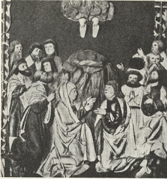
Abb. 351. Schnitzrelief am Hochaltar Heiligenblut Vollendet 1520