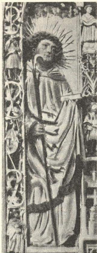
Abb. 353. Wolfgang Aßlinger: Vom Hochaltar Heiligenblut