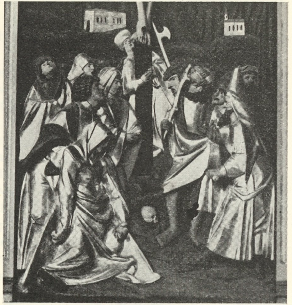
Abb. 352. Kreuzaltar in Seckau. Gefaßt 1523