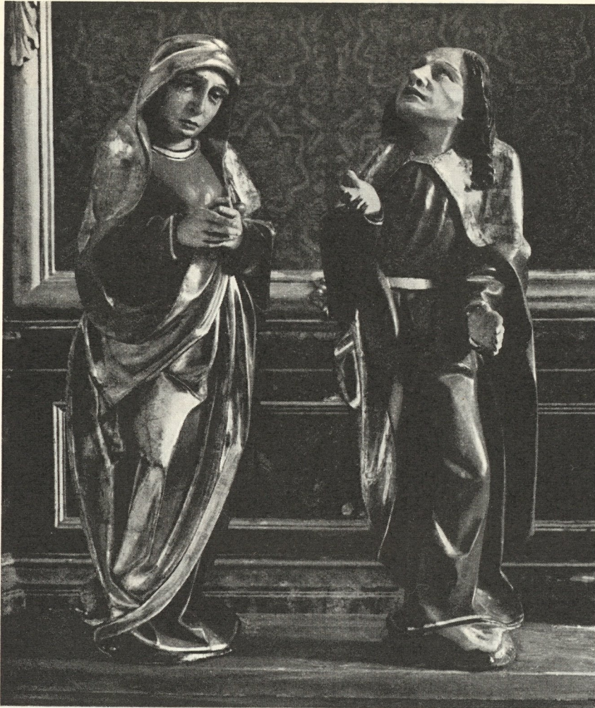
Abb. 337. Meister von Rottenmann: Kreuzaltarstatuen in Bretstein

Sohn, seßhaft zu Gais- horn, tue kund, daß ich meiner lieben Haus- frau Dorothe 28 Pfund Pfennige und all meine Habe und was wir mit- einander gewinnen, übergebe. Als Pfand setze ich die Erhart- Hube im Dorfe Gais- horn mit allen Rech- ten laut Urbar unserer Gnädigsten Herrschaft, dem Propst und Kon- vent des Klosters „zum Rottenmann“ . . . „Snyczzer“ ist hier kein Vulgarname — spätere Eigner der Hube führen andere Namen — sondern Be- rufsbezeichnung. Daß Thoman und Wolf- gang vor allem für ihre Herrschaft arbei- teten, liegt rechtlich und wirtschaftlich auf der Hand. Im Ennstal und im Paltental mag sich noch manche Skulptur befinden, die ihnen ihr Dasein ver- dankt, auch wenn wir