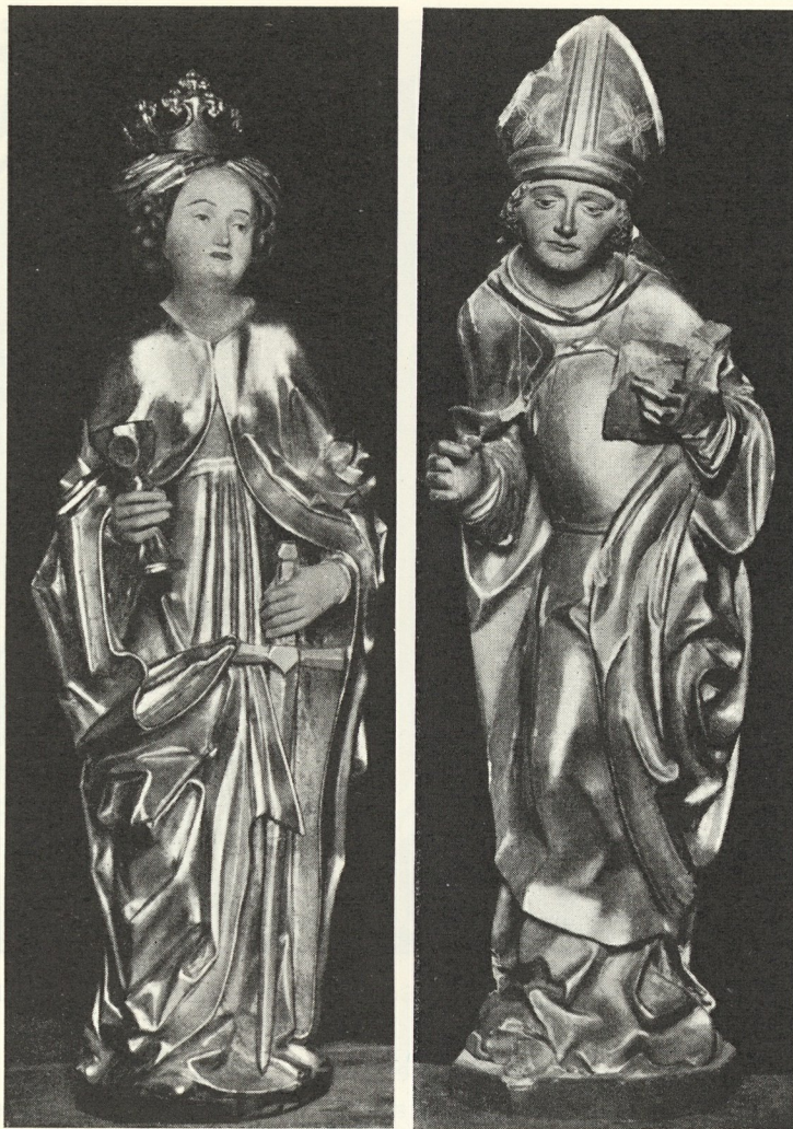
Abb. 338. Meister von Rottenmann: Barbara und Kirchenlehrer in Knittelfeld

Gestalt, Bewegungsmotiv und Faltenbild ermöglichen noch immer, dem Meister von Rottenmann andere Werke zuzuteilen. Mit dem Hochaltar ist wohl ungefähr gleichzeitig ein Kreuzaltar nach Bretstein gekommen. Der Crucifixus ist nicht mehr an Ort und Stelle, wohl aber Maria und Johannes (Abb. 337). Katharina und Ulrich tragen die Umhang-Enden gekreuzt, ebenso die Dolorosa. Eindeutig ähnlich das würfelige