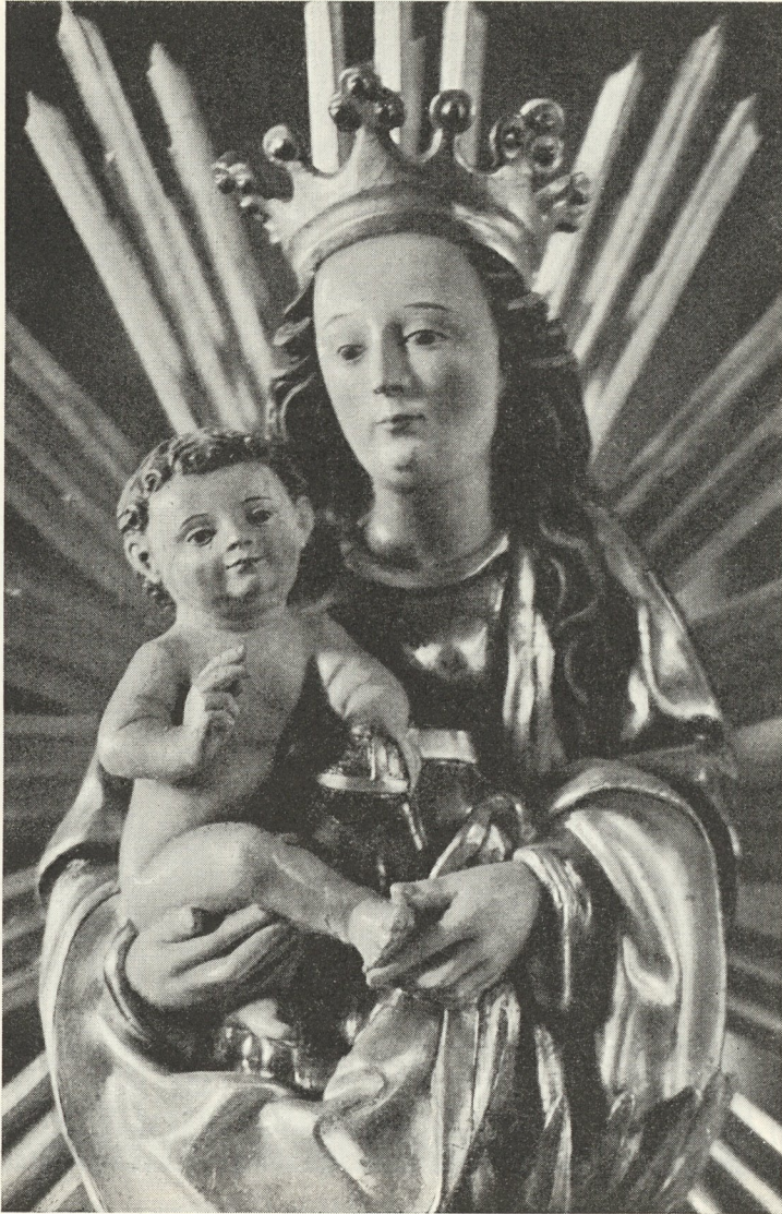
Abb. 343. Tragmadonna in Palfau. Vom Meister des Hallstätter Schreines