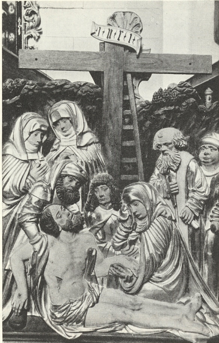
Abb. 340. Lienhard Astl: Schnitzrelief vom Apostelaltar zu Gröbming

Wertschätzer exakter und unvoreingenommener Kunstforschung werden verstehen,