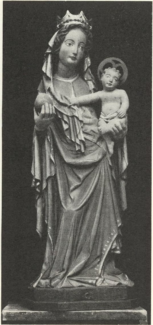
Abb. 331. Madonna von Übelbach. Um 1455