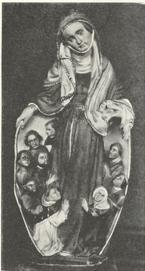
Abb. 330. Schutzmantel-Maria in Übelbach Um 1435

ger Künstler, der seinen Mann in all diesen Fachgebieten stellte. Ist das Auftreten mehrerer beglaubigter und namentlich genannter Künstler im Zusammenhang mit konkreten Leistungen in so früher Zeit für sich schon eine erfreuliche Überraschung, wird es für unser Stift und die — Grazer Kunstgeschichte doppelt bedeutsam, wenn wir feststellen, daß dies kein einmaliger Fall, sondern sozusagen ein Dauerzustand war, daß also Rein in der Ära der Gotik zumindest anderthalb Jahrhunderte eine stiftshörige Bildhauer- und Malerwerkstatt beherbergte und beschäftigte. Für die archivalisch so stiefmütterlich dotierte Grazer Kunstforschung wird sie zu einer geradezu sensationellen Ergänzung und Bereicherung, ja zu einer Neufundamentierung ihres bisher so dürftigen Wissens