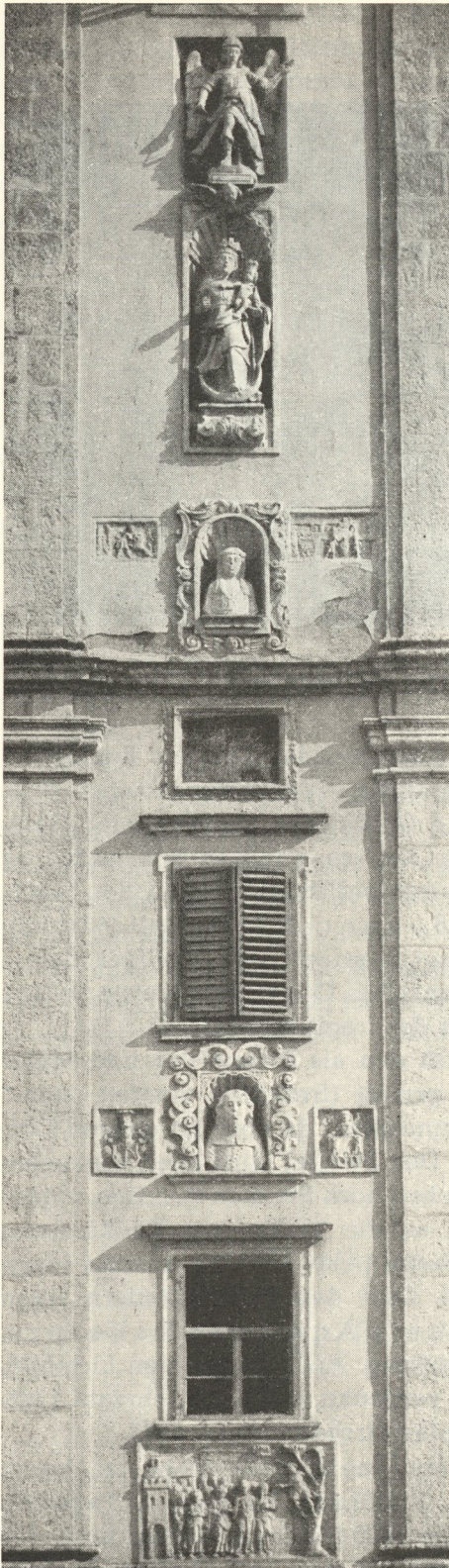
Abb. 327. Rathhausturm Mureck. 1668