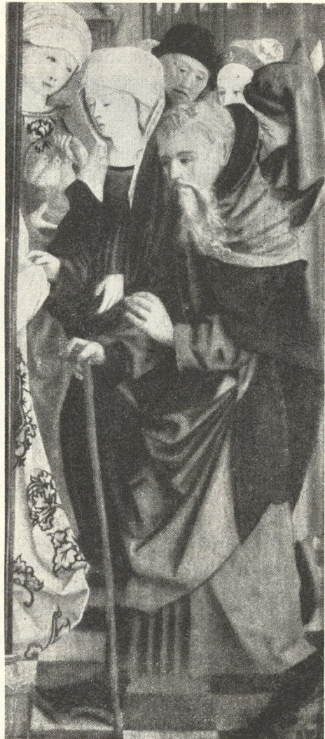
Abb. 325. Meister von Mondsee: Darstellung Jesu im Tempel (Paris)

Doch uns interessiert hier nicht die Landschaft, sondern in ihr die Gestalten. Denn nur sie können die Fragen lösen, die uns längst auf den Lippen liegen: Wirken auch sie so ätherisch wie die Landschaft, gleichen sie nach Physiognomie und Anatomie irgendwie