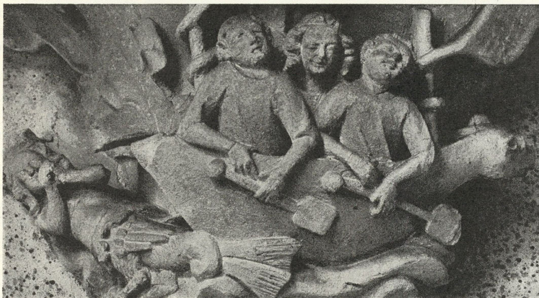
Abb. 309. Sphynx und Odysseus. Konsolenplastik im Kreuzgang. Um 1350

„Folgend den Fußspuren Unserer Vorfahren und des Erlauchtesten Herrn, Friedrich Römischen Königs, Unseres Herrn und geliebtesten Bruders“, stiftete Herzog Otto der Fröhliche, zu Krems an der Donau, am 13. August 1327 das Zisterzienserstift im Neuen Berge. In großräumiger Konzeption legten die Mönche des großzügigen Bauordens den Grund zu einem riesigen Münster in reinem Rechteck und anstoßend zu einem Kreuzgang mit vorgelagertem Kapitelsaal. Letztere konnten bereits am 1. Jänner 1344 die Weihe empfangen, die Kirche selbst ward erst am 28. April 1471 konsekriert, auch damals noch baulich unvollendet, jedoch mit 15 Altären.