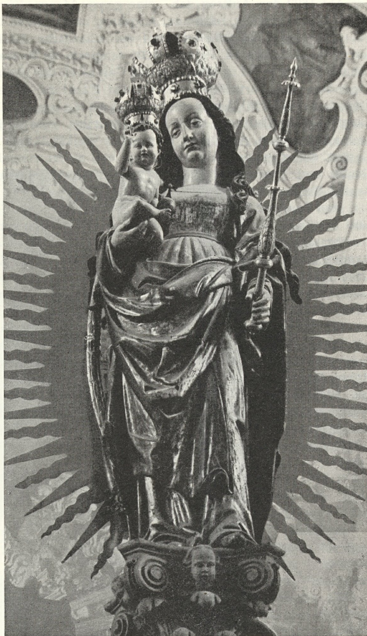
Abb. 302. Urlaubsmadonna unterm Kuppelraum. Um 1530