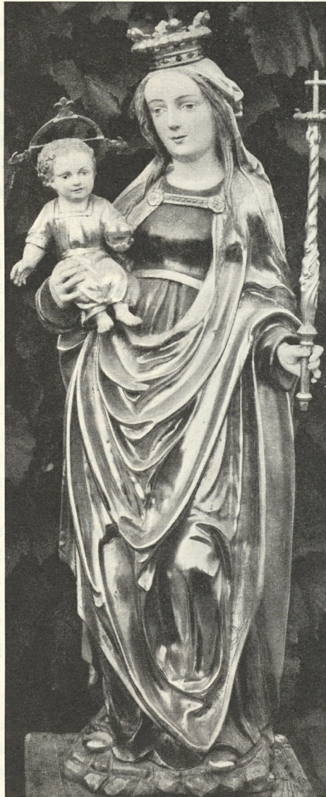
Abb. 238. Unsere Liebe Frau im Dornach Um 1520

Im Pfarrhof befindet sich eine wunderliebe spätgotische Maria mit Kind (Abb. 238): Wohl die einst hochverehrte „Unsere Liebe Frau von Gness“ oder „Unsere Liebe Fraw im Tornach“, die der Legende zufolge einst im Dornestrüpp aufgefunden wurde. Weder bei Garzarolli noch im Dehio angeführt, ist sie von hohem Liebreiz, aber auch künstlerischer