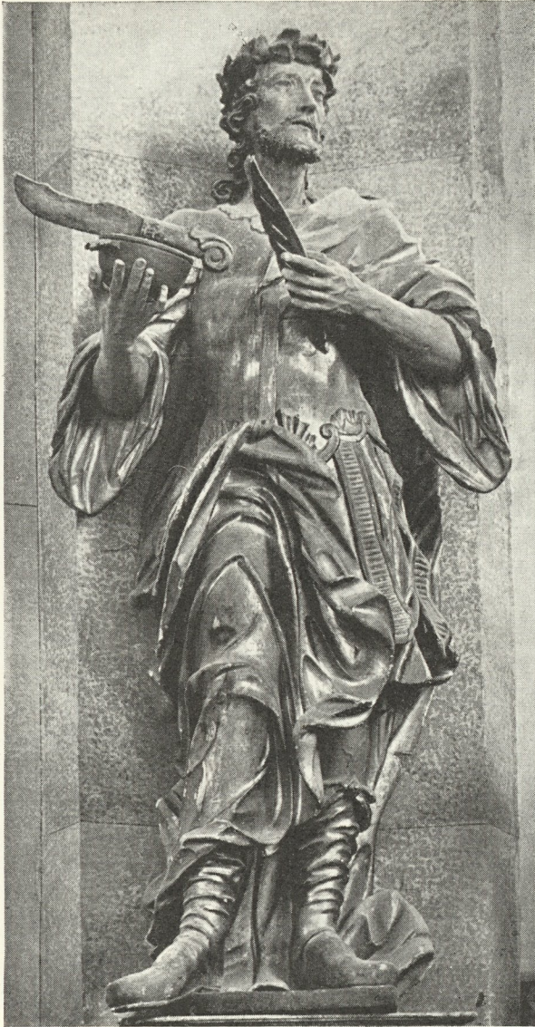
Abb. 228. Donatus am Hochaltar zu Fehring Von Friderikus Liebentreu?

daß zu den Riegersburger Bauten wiederholt Feldbacher Meister herangezogen wurden. Auch zu Steinmetz- und Bildhauerarbeiten? Eine recht entfernte Möglichkeit also, doch sie sei verbucht: Bildhauer Mechtig? Grazerisch dünkt mich dieser oststeirische Volkssturm-Mars nicht.