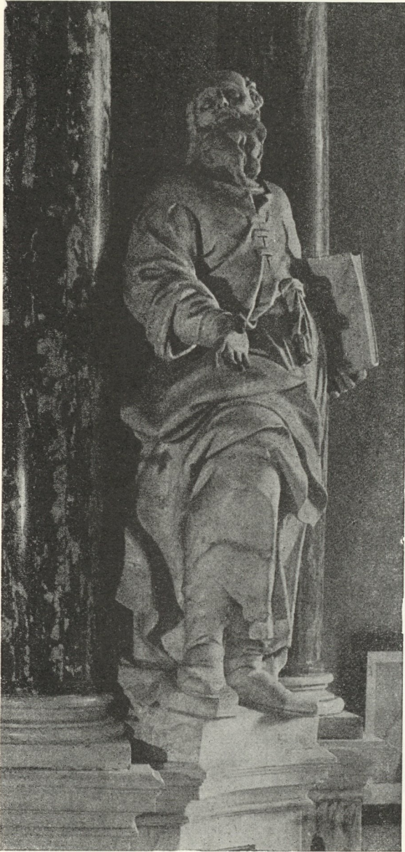
Abb. 149. Joseph Schokotnig: Joachim im Dom 1743