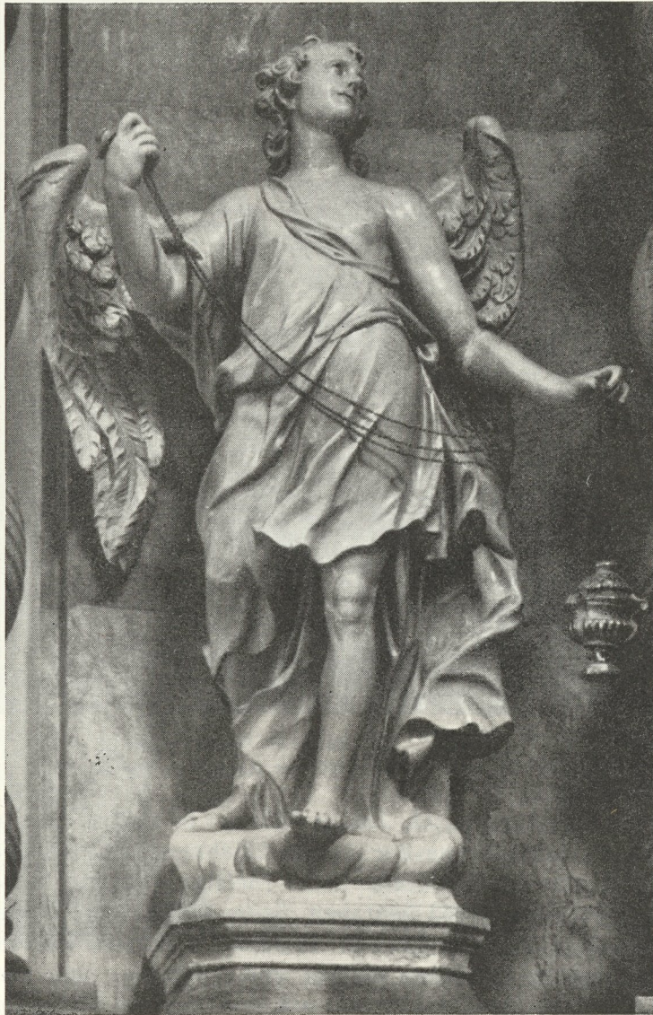
Abb. 145. Joseph Schokotnig: Hochaltarengel zu Mariatrost. 1752

bedeutete wohl auch die Übernahme der väterlichen Werkstatt. Doch schon 1719 wird der 19-jährige Jüngling mit einer eigenen Leistung in Kirchenrechnungen genannt, in der Franziskanerkirche schuf er etliche Architekturteile für einen Altar. Ihn baute nicht sein Vater, sondern Johann Jakob Schoy, der dort vorher und nachher als einziger Bildhauer wiederholt genannt wird. Das bedeutet hochwahrscheinlich, daß der junge Schokotnig als Geselle bei Schoy arbeitete.