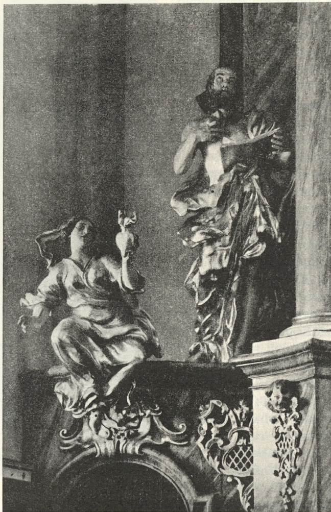
Abb. 151. Hochaltar der Ursulinenkirche von Marcus Anton Schokotnig?