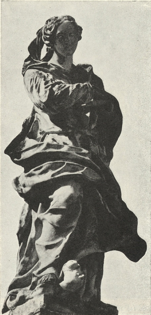
Abb. 141. Matthias Leitner: Immakulata zu St. Lambrecht. 1746