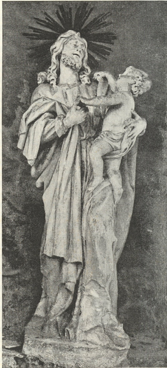
Abb. 133. St. Josef in Schönberg von Schoy. 1724

Als ahnte der Meister, daß seine Tage gezählt seien, vielleicht richtiger, als fühlten die Schätzer seiner Kunst, daß sein erlesenes Schnitzmesser, sein erprobter Meißel nicht mehr lange zur Verfügung stehen würden, von allen Seiten meldeten sich Kontrahenten: 1728 noch die Minoriten von Mariahilf um eine Steinstatue St. Antonius, heute im Kreuzgang, aber auch seine engere Heimat: Maria Rast bei Marburg, wo er einst