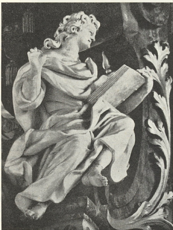
Abb. 130. Vom Hochaltar im Dom Von J. J. Schoy 1732

Evangelista am Hochaltar des Domes (Abb. 130) aus — wie von seinem gesamten reichen