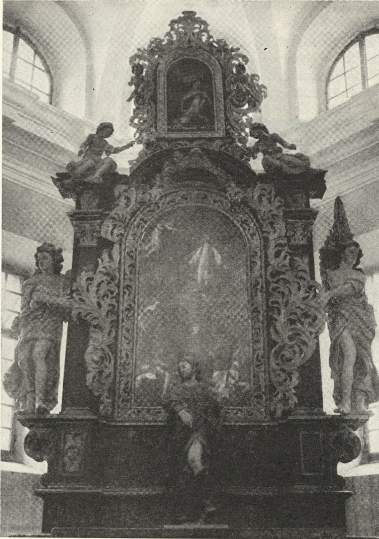
Abb. 131. Altar in Neustift. 1690 Vom Lehrmeister J. J. Schoys

fordern hatte. Am 13. Juni 1617 melden sie, daß einer seiner Lehrbuben eine kleine Spitzbüherei anstellte, dieweilen der Chef in — Marburg weilte.