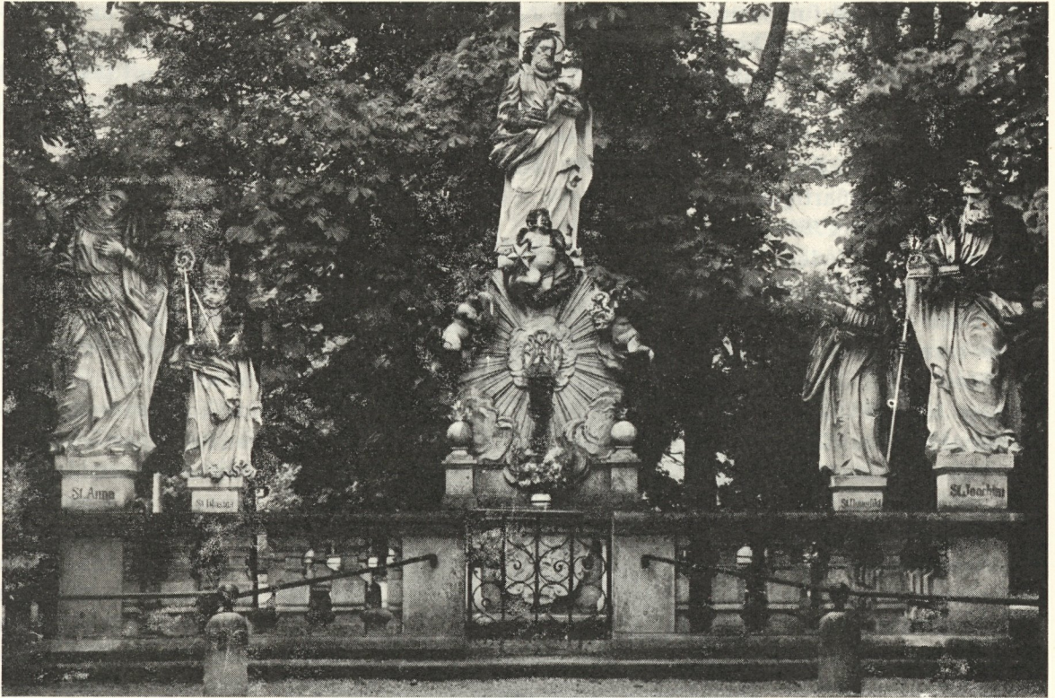
Abb. 123. Mariensäule zu Admont von G. Chr. Winkler. 1712

der Handt". Ohne „Wasen" sollen sie 6 Schuh 8 Zoll hoch sein, wie die Grazer Dreifaltigkeitssäule aus gutem Leibnitzer Stein. Honorar für jede Statue 34 fl, wenn sie bis 8. Dezember fertig sind, sonst für jeden späteren Tag 1 fl Abzug.