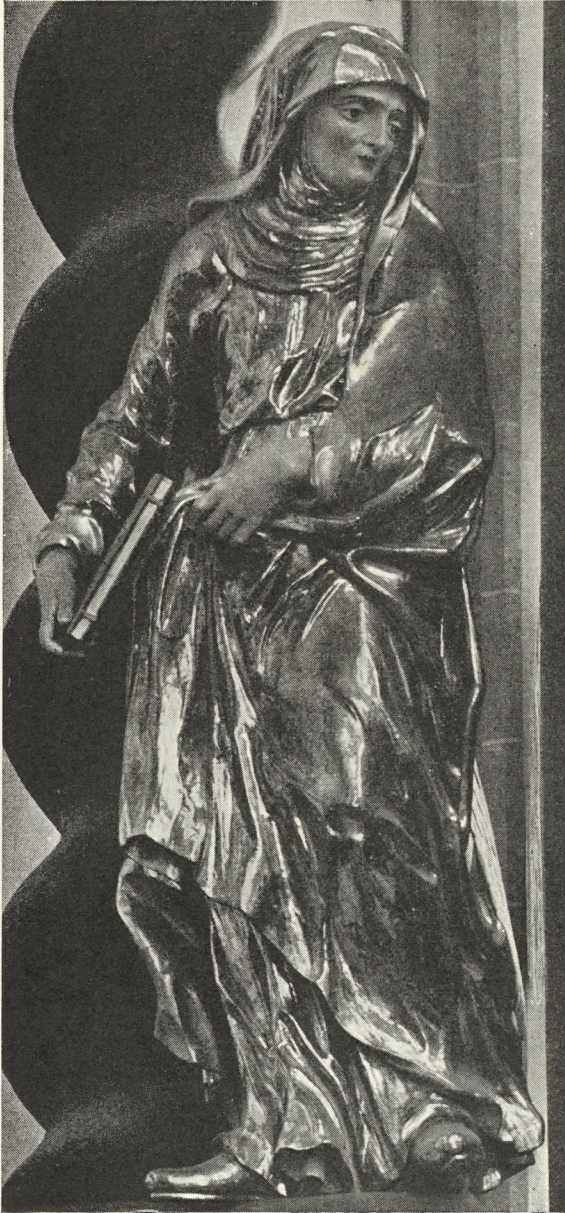
Abb. 129. Anna auf Pöllauberg von Marx Schokotnig 1714