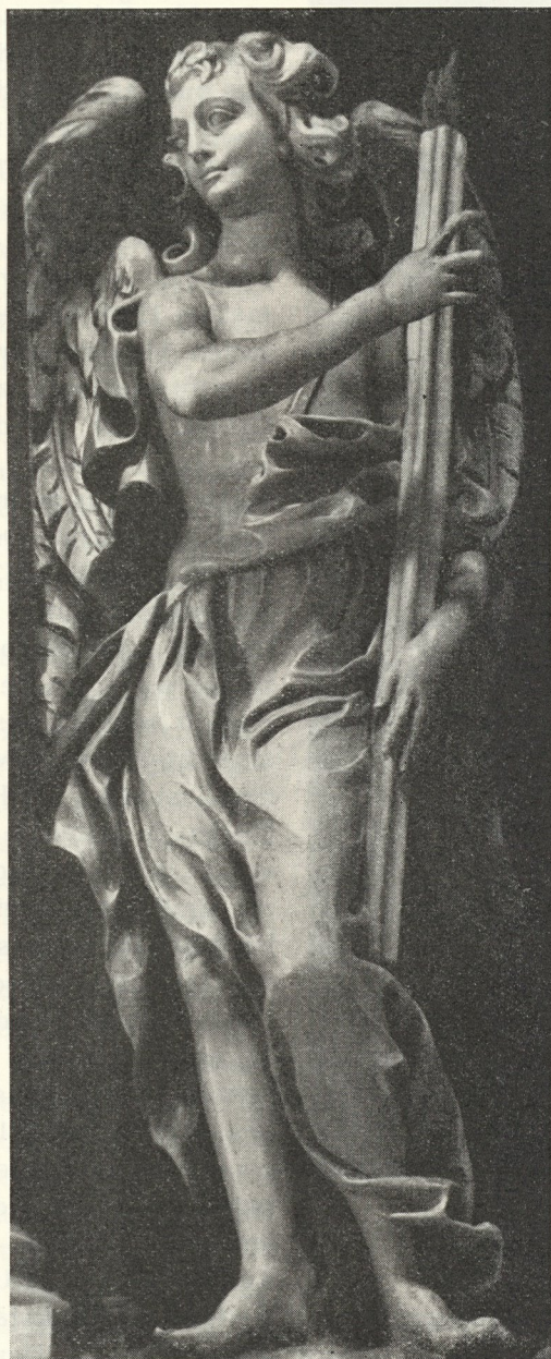
Abb. 126. Engel im Mausoleum von Marx Schokotnig. 1700

Marxen Schukhenig, Bildthauer in Grätz, in Münzgraben (?) auf der Khuetratten wohnend“, die Steinstatuen Ceres, Flora und Diana bestellte, bedang er sich ausdrücklich aus, daß sie wohl in bester „und formblichster Bildthauer-Khunst und Manier“ gearbeitet sein sollen, allein „nit vill blos an Leib“ nicht zu dürftig gewandet. Derselbe Wunsch mag schon früher des öfteren geäußert worden sein, denn nun tragen seine