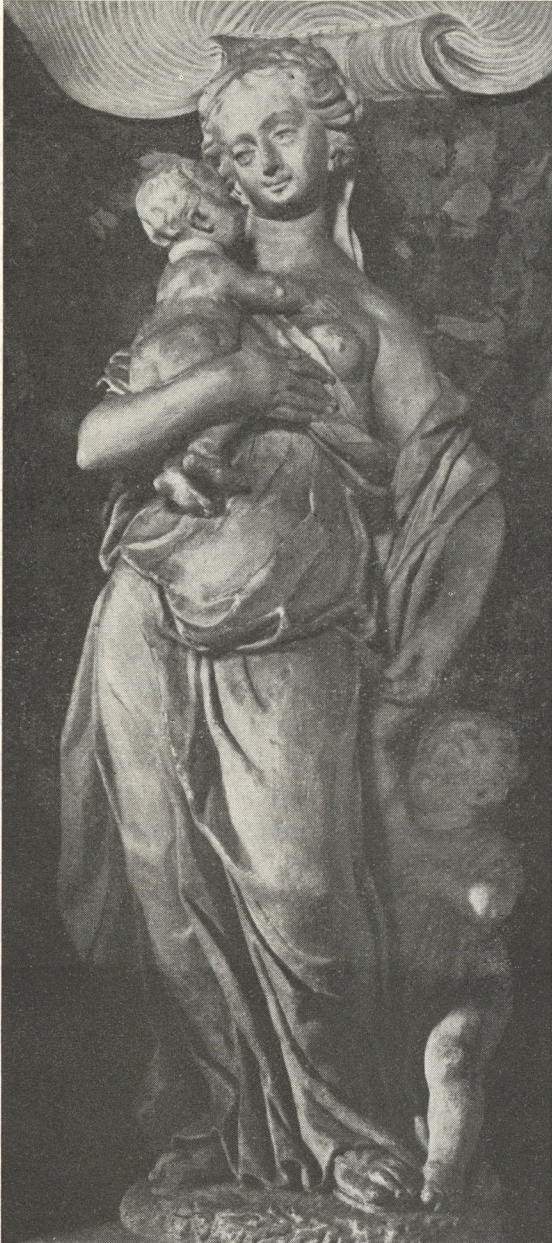
Abb. 127. Caritas im Mausoleum von Marx Schokotnig. Vor 1700

Frauen, ob geistlich oder weltlich, ausgesprochen nonnenhafte Kleidung: Der Umhang verdeckt als weit vorgezogene Haube das Haupthaar, unter ihr schlingt sich ein breites Faltentuch über Hals und Schultern, eine Hand hüllt sich in den Umhang, darunter breitet er sich in tiefzielendem Rhombus quer zur Fußschaufel des Spielbeins.