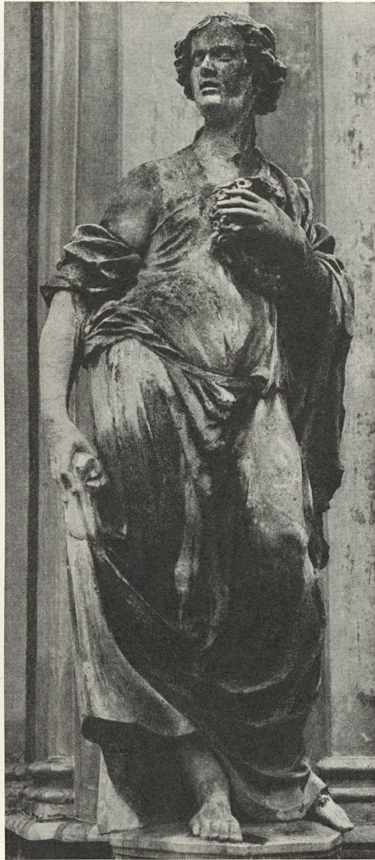
Abb. 128. Flora am Meerscheinschlüssel von Marx Schokotnig um 1700

Thieme-Becker schrieben dem Meister u. a. noch zu eine Muttergottes an der Tafel am Fuße von Mariatrost. Diese Zuweisung bestätigte mein Barockbuch, in dem ich faksimiliert nachwies, daß er auch die drei Giebelstatuen der Wallfahrtskirche schuf. Die dortigen Abbildungen 84 und 85 stellen die Werke gegenüber, ihnen möchte ich