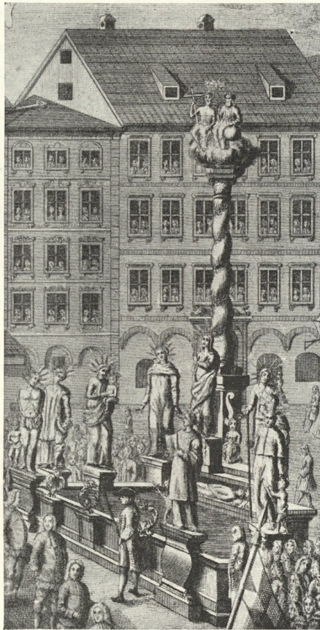
Abb. 109. Grazer Dreifaltigkeitssäule nach einem Stiche 1728

So tragisch die Kontagion 1680 sich an der Gesamtbevölkerung auswirkte, für die Bildhauer von Graz, Steiermark, Wien und Österreich schuf sie eine wahre Hausse an Aufträgen. Bei der Aufstellung der Wiener Gradenstein den Kontrakt, er ist noch eigenhändig unterzeichnet in zweifacher Ausfertigung im erwähnten Faszikel hinterlegt. „Mit zuegesetzten Englen“ schuf er um 600 fl acht Statuen: Ignatius, Franz Xaver, Sebastian, Rochus, Josef, Anton v. P., Ägidius, Johann Nepomuk, jede 7 Schuh hoch, aus Leibnitzer (Aflenzer) Sandstein. Ferner zwei knieende Engel „von gleicher Proportion“, eine liegende Rosalia, sowie 24 Basreliefs „oder flach gehauene Historien“. Eine Maria war schon 1716 gemeißelt worden, um das Ordenskleid des Paduaners herrschte ein jahrelanger Bruderstreit zwischen Franziskanern und Minoriten, der vom Kaiser höchstselbst zu Gunsten der Franziskaner entschieden, inzwischen aber von den Minoriten durch ein Fait accompli gelöst wurde. 1789 übernahm Steinmetzmeister Pack die Statuen, seitdem sind sie verschollen. Und die ursprüngliche Garnitur? Im Geding übernahm S c h o y auch die Verpflichtung, die dormalen all dort befindlichen Statuen abzunehmen „und selbe auf ein ihm anzeigendes Orth vberbringen zu lassen“. Wohin? Zwei Fuhrmannsrechnungen greifen entschei-