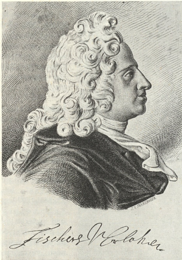
Abb. 105. Johann Bernhard Fischer von Erlach

„Ingenieur“ hat dem Kaiser einen weitgehenden Abänderungsvorschlag in Grundriß und Aufbau der Säule gemacht, Ihre Majestät hat sich ihn „allergnädigst gefallen lassen“. In 7 Punkten ward der Plan umrissen: Die Postamente sollen mit Tiefreliefs umkleidet werden, die 9 Engelhöre von den Kragsteinen weggenommen und anderswo postiert, die Dreifaltigkeit nicht in Form eines Gnadenstuhles dargestellt werden, Vater und Sohn nebeneinander in glorifizierten