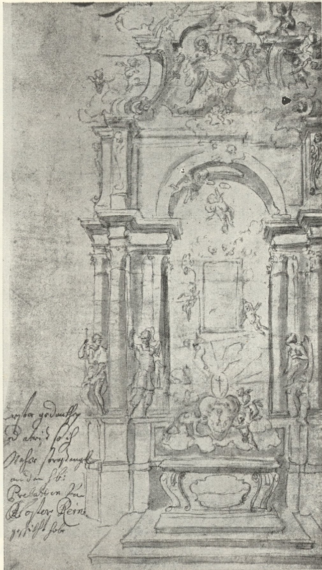
Abb. 107. Johann Bernhard Fischer von Erlach: Hochaltarentwurf Straßengel

Interessant gleichfalls die Gegenüberstellung dieses Hochaltares mit dem im Mausoleum (Tafel 104). Die Stukkos des Kuppelansatzes mögen als Proben des imposanten Gesamtwerkes gelten, der Hochaltar sinkt freilich unter ihnen schlicht in die Tiefe. Die vier Holzvoluten zuoberst bilden, der dynastischen Idee dienend, eine mächtige