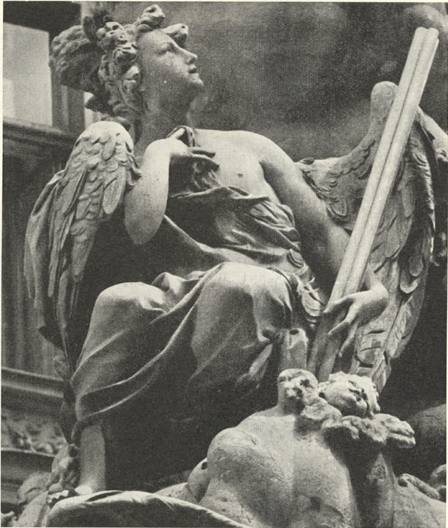
Abb. 104. Johann Frühwirt: Genius an der Wiener Grabensäule.

Phantasien? Vielleicht, doch fußen sie auf dem Boden und den Möglichkeiten der Wirklichkeit. Eines ist und bleibt gewiß: Durch meine archivalisch beglaubigte Einver- leibung Johann Frühwirts in die Werkstatt Johann Baptist Fischers wächst dieser ein unerwarteter Ruhm zu. Die kirchliche Metropole Salzburg wie die kaiserliche Residenz- stadt Wien schickten dem Vater Fischers von Erlach ihre Kunstjünger zur Ausbildung zu, er ist „würdig“, eines Genies Vater zu sein . . .