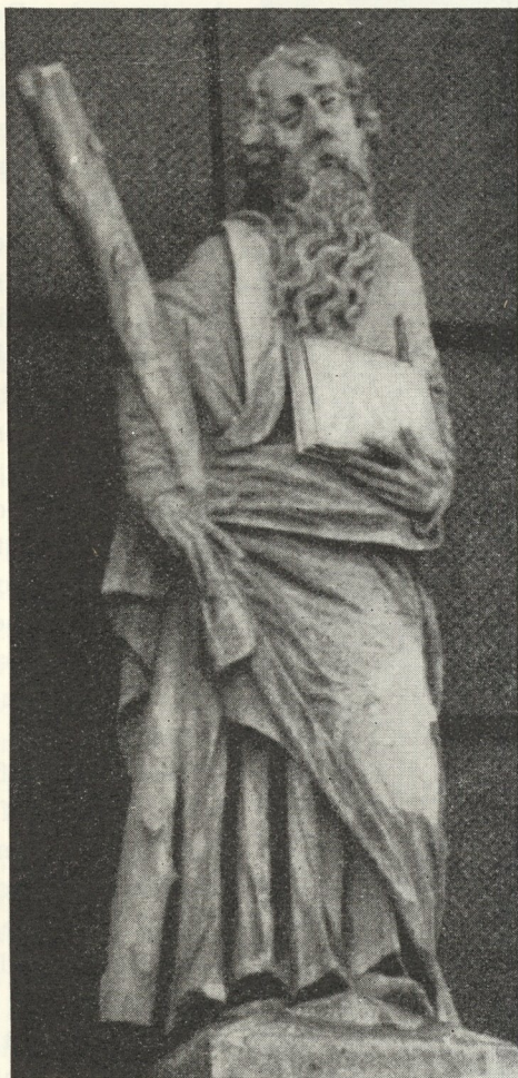
Abb. 78. St. Andreas zu St. Andrä, von H. H. Rechpaum? Um 1630

Wohin wir blicken, all seine Bekannten sind Steinhauer, wann immer er genannt wird, heißt er Steinmetz, einmal nur kunstreich. Steinmetzarbeiten, gewiß ausgiebige und an prominenten Baustellen, sind es, die man ihm übertrug. 1629 legte er detailliert Rechnung für seine Leistungen an der landschaftlichen Kirche D o b e l b a d, in der unter anderem genannt werden: Ein Kranz von harten Steinen um die Kirche, 4 Pilaster an der Fassade mit Postamenten und Kapitellen, das Portal, eine Säule vor demselben, die Sakristeitüre, 7 ovale Fenster, Grundstein, Pflaster und Stiegenstufen; 1084 fl berechnet