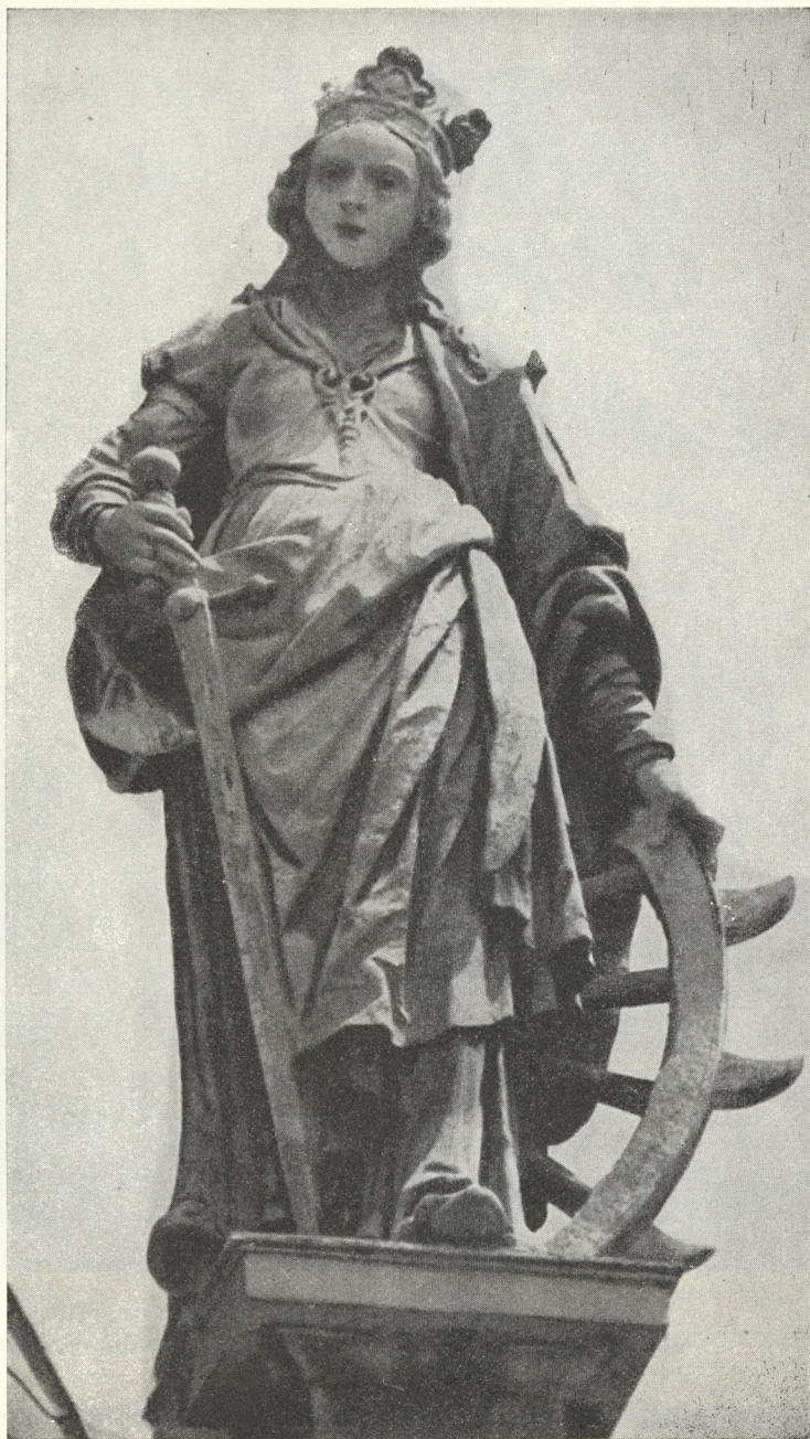
Abb. 80. St. Katharina auf dem Mausoleumsgiebel. 1635

Kriegsgott Mars und Kriegsheld St. Ferdinand von Kastilien tragen dieselben Phantasieuniformen des Dreißigjährigen Krieges, sie sehen also, zumindest von der Ferne aus betrachtet, wie Zwillinge aus. St. Katharina (Abb. 79) gibt sich gegenüber Bellona breiter, flächiger, voluminöser, unorganischer, vielleicht sogar plumper. Doch fällt gleich ins Auge, daß wie der Schurz der Göttin auch das Prunkkleid der alexandrinischen Fürstentochter reichen plastischen Schmuck, erhaben herausgemeißelt, trägt, daß sich auch an ihr der statuarische Kontrapost andeutet, der sich an Bellona so meisterlich rundet und vollendet, daß die Haarbehandlung in ähnlichen Wellen