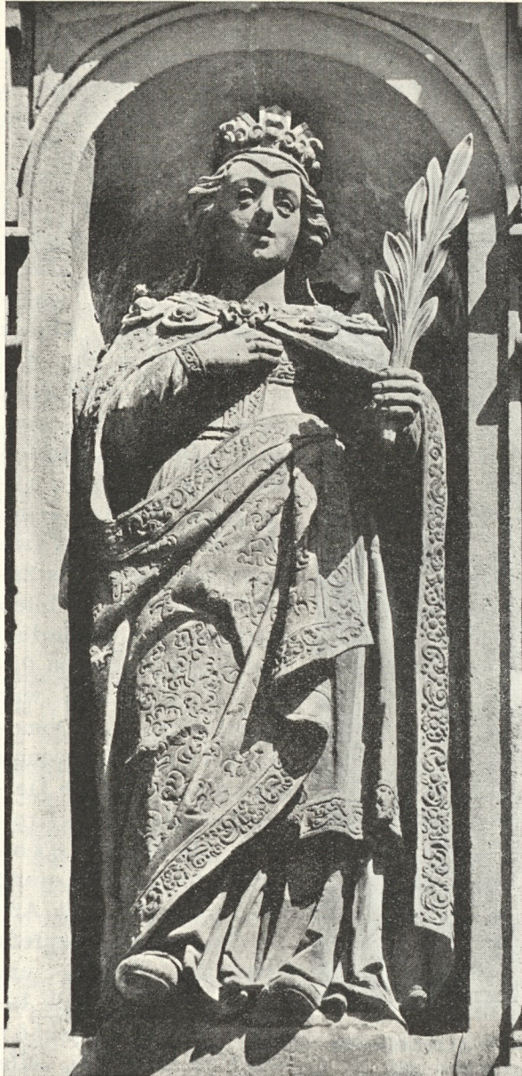
Abb. 79. St. Katharina an der Mausoleumsfassade. 1635

Sandsteinheiligen der Stadtpfarrkirche der kostbare plastische Schmuck der Grazer Nobelgasse, gemeißelt. Wenn wir der bedeutsamen Sache richtig auf den Grund kommen sollen, heißt es trotz des an sich klaren Wortlautes nach ausgesprochenen Bildhauern Ausschau zu halten, die diese prachtvollen Monumentalplastiken geschaffen haben könnten, vorläufig muß Maestro Giovan Mamol als Schöpfer gelten, für immer wird ihm der Ruhm gewahrt bleiben, daß er einen so trefflichen Künstler des Meißels für diese delikate Aufgabe gewählt und beraten, höchstwahrscheinlich ihm auch durch eine kunstvolle Deliniation vorgearbeitet hat.