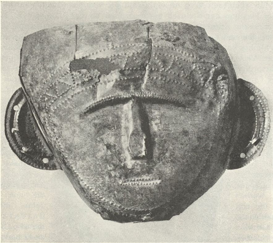
Abb. 7. Bronze-Maske aus Klein-Klein