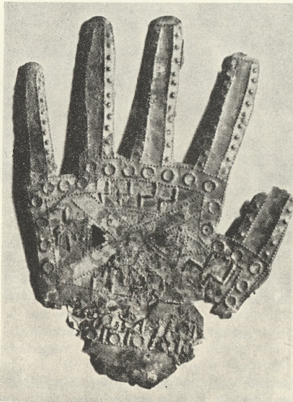
Abb. 8. Abwehrhand aus Klein-Klein Höhe der Hand 14 cm

Es steht nirgends in den Sternen geschrieben, daß nicht eines schönen Tages etwas ähnliches in Steiermark zur Sonne gehoben werden kann. Wie die erst 1954 erschienene große „Urgeschichte des Österreichischen Raumes“ von Richard Pittioni solenn und ausführlich dartut, steht unser Heimatland und seine Bewohnerschaft in der Steinzeit in Ehren da. Sie schreibt: „Mit den