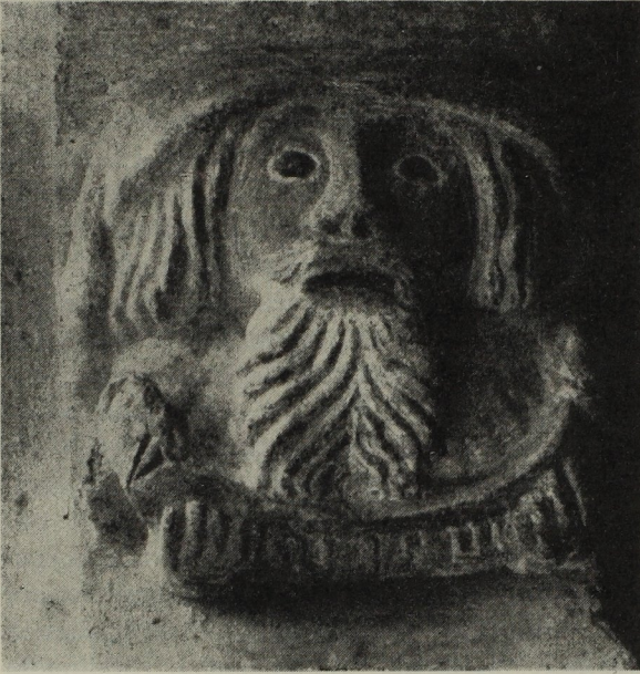
Abb. 258. Prophet Isaias am Hirschegger Hauptportal. Selbstporträt des Steinmetzen Ulrich?