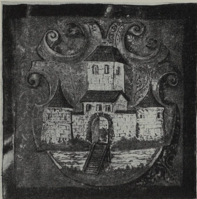
Abb. 278. Feste des Weizer Wappenbriefes 1560.