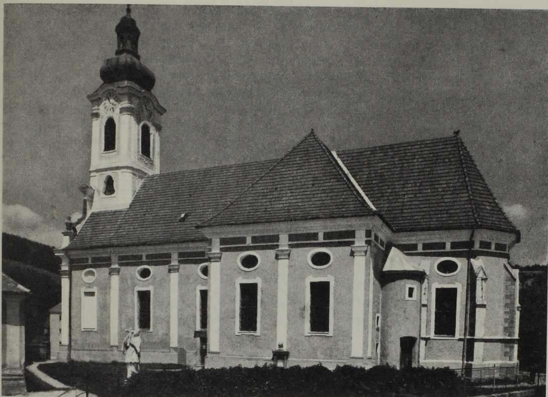
Abb. 277. Wallfahrtskirche Pinggau, ihr Langhaus 1702—1706 erbaut von Andreas Straßgiel.

Biasino“, konstatiert auch, daß derselbe Meister 1676 den Grazer Vorauer Hof neu aufbaute und daß 1688 der Bau des Osttraktes der Prälatur begonnen wurde.