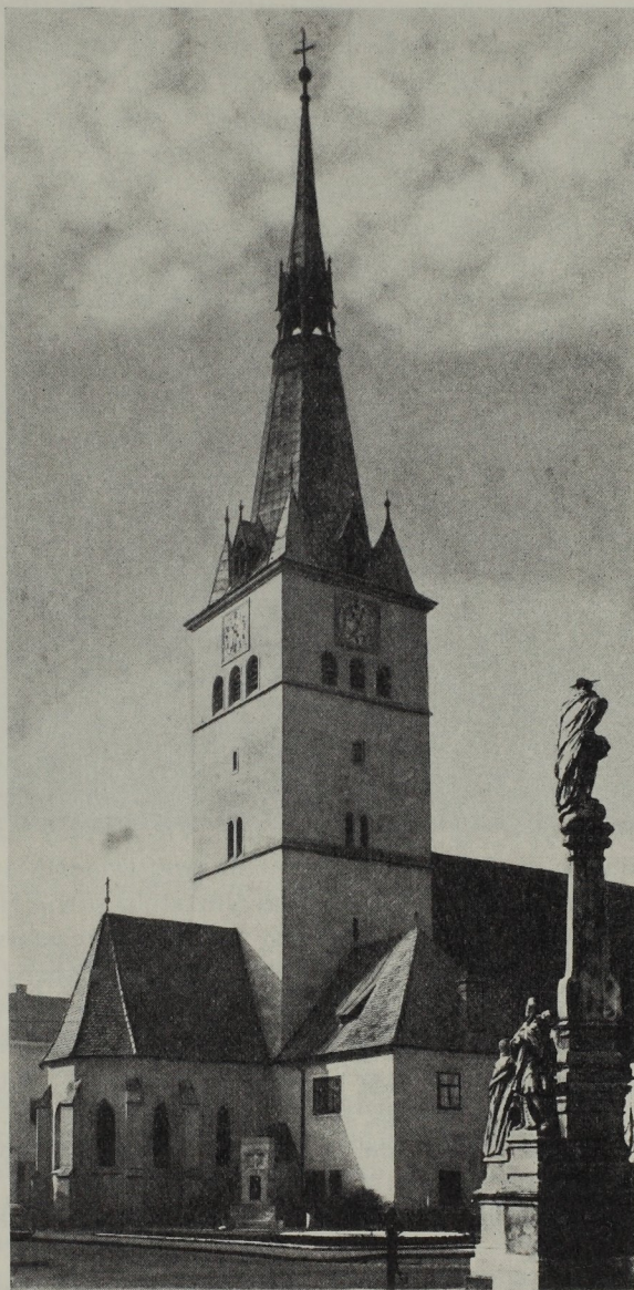
Abb. 274. die alte Pfarrkirche St. Michael.