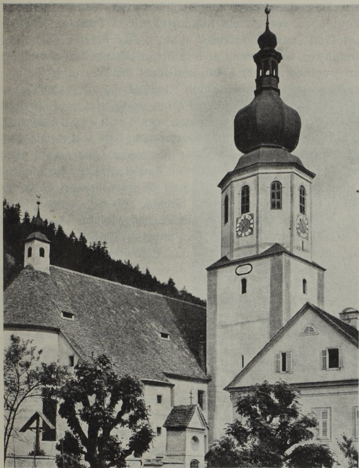
Abb. 264. Turm der Pfarrkirche Anger.