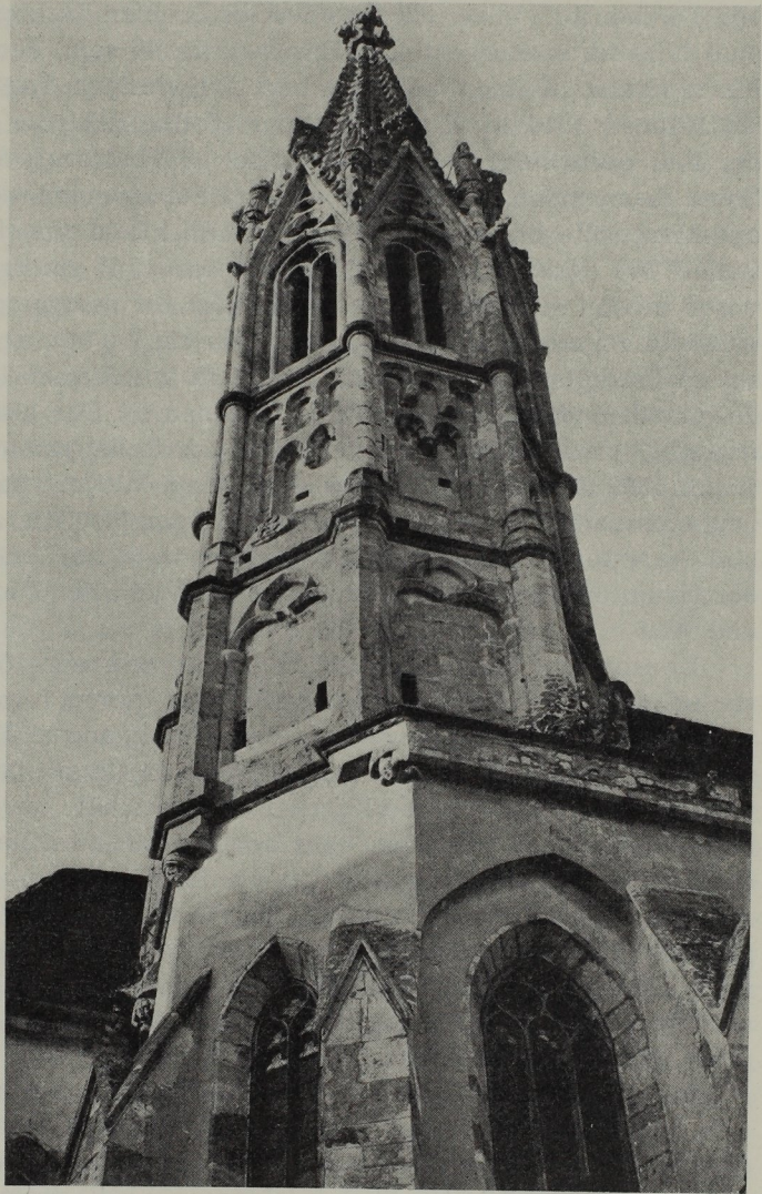
Abb. 257. Straßengels Turmhelm.

St. Georgskapelle, an der Presbyterium und Langhaus beinahe gleich lang ausgefallen sind, im letzteren weihte Bischof Ulrich von Gurk am 8. Juni 1462 drei Altäre zu Ehren Fronleichnam, Maria und Anna. Gotisch sind noch rechts von der Georgskapelle der dreigeschossige Eckturm, ein Reststück der Wehrmauer, die Abt Wolfgang Schrötl (1480—1515) rings um das Stift zum Schutze vor den Türken aufführen ließ, sowie die beiden Türme mit Keildach im Rücken des Münsterkomplexes, von denen Teilstücke noch in unsere Zeit bestehen blieben. Schließlich sehen wir noch am Abschluß der Hausfront, die vom Kirchturm nach links führt, ein sichtlich gotisches Kirchlein mit einem