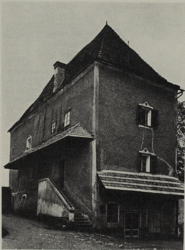
Abb. 247. Taferne, 1490—1492 erbaut von Meister Rueprecht.

Das vielgenannte Stockurbar Pibers vom Jahre 1493 beginnt mit den Worten: An ersten wellen wir, daz vnnser Grundtpuech in vier tayl getaylt werde. Das ayn tayl zu Sannd L a m p r e c h t, das annder zu Affl entz, das dritt zu Zell vnd das vierdt tayl zu Piber. Über die zahlreichen Kirchen, die schon in der Ära der Romanik zum Priorat Piber gehörten, unterrichtet eine Pergamenturkunde des Staatsarchives, zu Voitsberg ausgestellt am 12. Jänner 1245: Landschreiber Witigo von Steiermark sieht sich veranlaßt, die Offiziale, Richter, Ordnungsorgane und Bürger der Umgebung zusammenzurufen und die Schenkungen des Herzogs Leopold an die Mutterkirche Piber festzuhalten. Als ihre Filialen werden genannt: Gelenschrot (Edelschrott), Modriach, Paka (Pack), Chovelach (Köflach), Chaynach (Kainach), Stalhoven, Hirzek (Hirschegg), Salhe (Salla) und Gaystal. Mit Ausnahme von Köflach und Modriach, die Pfarrkirchen aus der Renaissance und