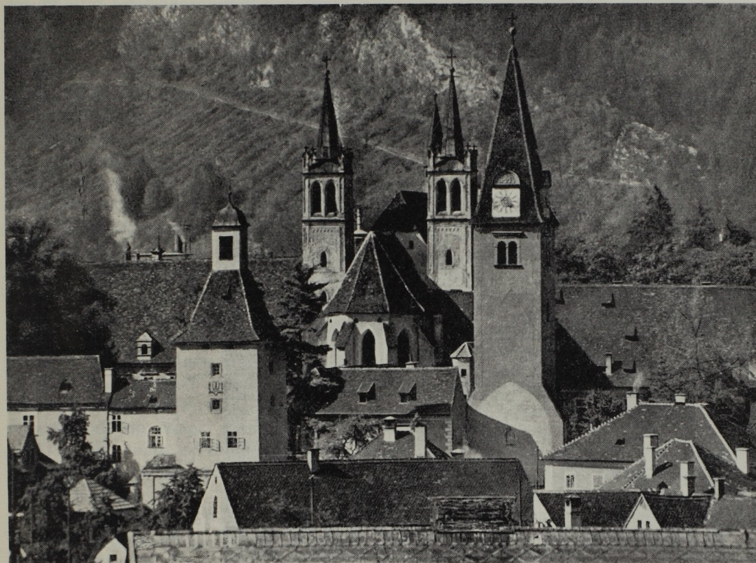
Abb. 224. Blick in den Klosterbezirk Göß.

Links Torturm aus dem Jahre 1482. Stiftskirche. Rechts Glockenturm der abgebrochenen Pfarrkirche