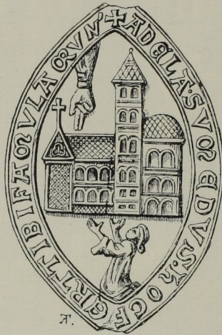
Abb. 225. Gösser Siegel aus dem 13. Jahrhundert.