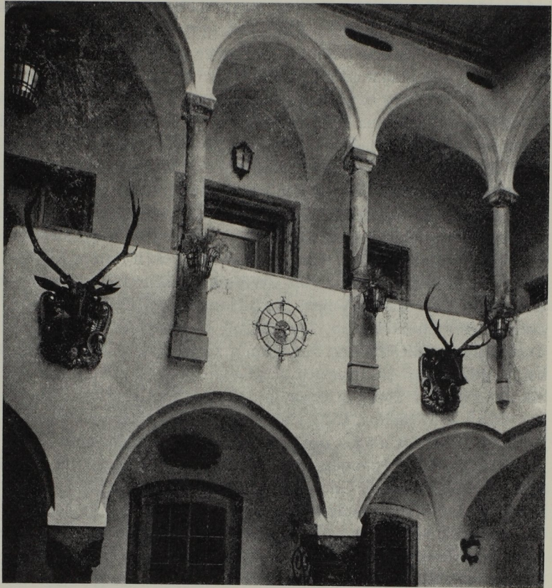
Abb. 227. Das Leobner „Arkaden-Restaurant“.