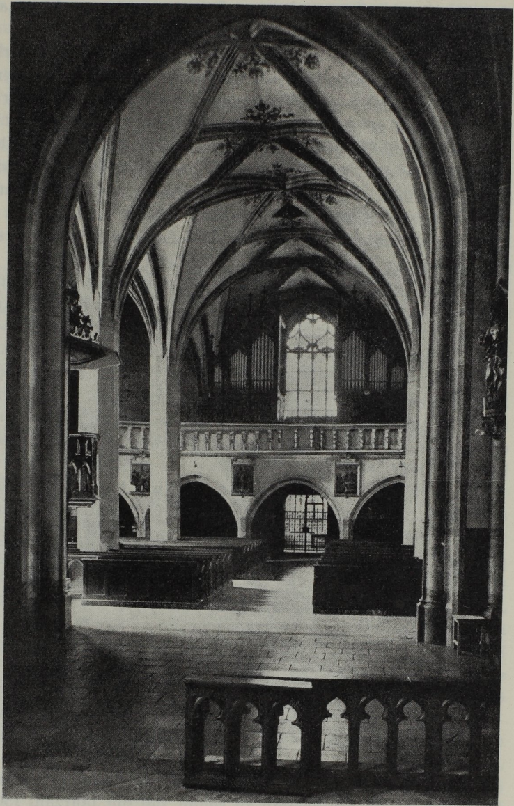
Abb. 207. Die einstige Stadtpfarrkirche Knittelfeld.

Ein Lichtbild der Pfarrchronik zeigt in trefflicher Aufnahme die einstige Innenansicht (Abbildung 207) des stattlichen Langhauses: Die schlichten Achtecksäulen kontrastieren gegen die solid und sorgfältig profilierten Laibungen des Chorscheidebogens. Man hat das Gefühl eines Bruches in der architektonischen Entwicklung. Noch heute reichlich vorhandene Jahreszahlen bezeugen eine verhältnismäßig