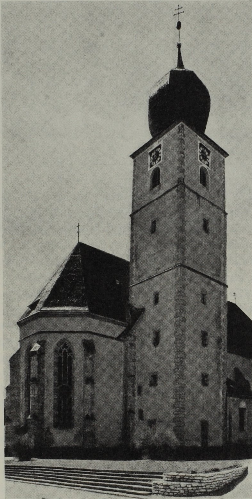
Abb. 188. Pfarrkirche Gröbming.