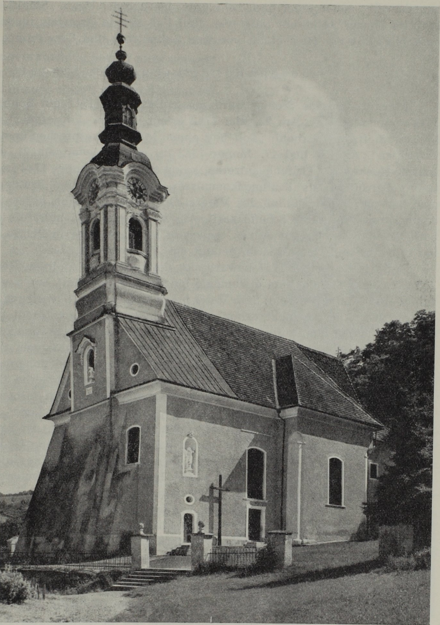
Abb. 138. Johann Georg Stengg: Pfarrkirche in Wolfsberg.

eine massive Stützmauer ein wirksames Paroli zu bieten. Inneres: Von der andersgerteten Plazierung der Seitenaltäre war bereits die Rede; in Rein (Tafel 120 und 121) und bei den Barmherzigen beiderseits Emporengänge, in Mariatrost fehlen sie; die Pfeiler, obwohl auch hier schon üppige Blattkapitelle und reich gestufte Gesimse tragend, betonen noch klar die Stellung in Reih und Glied, bei Johann Georg Stengg schmeicheln sie ausgesprochener der Schaufreude, sind, zumal in Rein, modellierter und modularer, die Raumdurchdringung und Raumverschleifung ist vorgeschrittener.