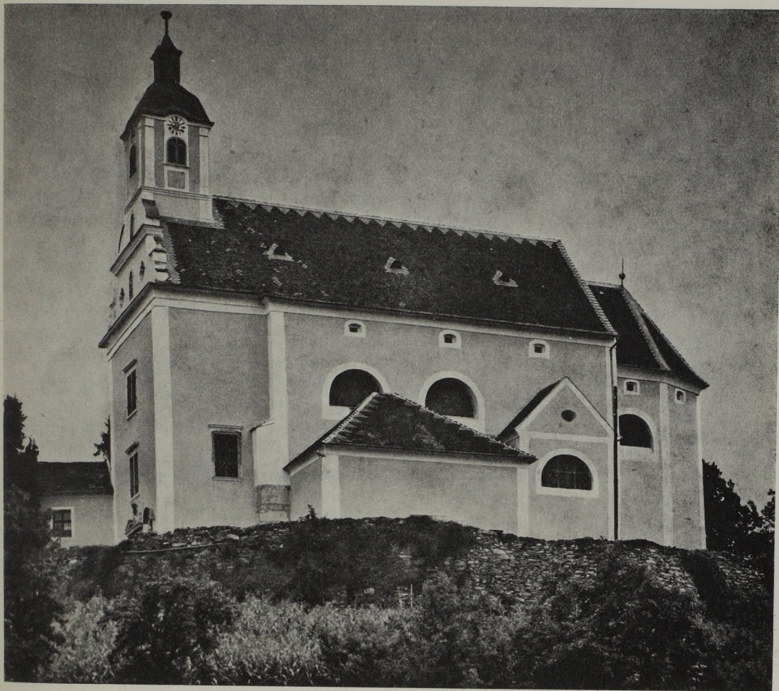
Abb. 120. Kirche St. Johann ob Herberstein. Entwurf Antonio Solar, Bauausführung Polier Michael Arhan

von der Zunft den Meisterrang erhalten, sie ihrerseits geloben, das Bürgerrecht anzunehmen und sich hier häuslich niederzulassen.